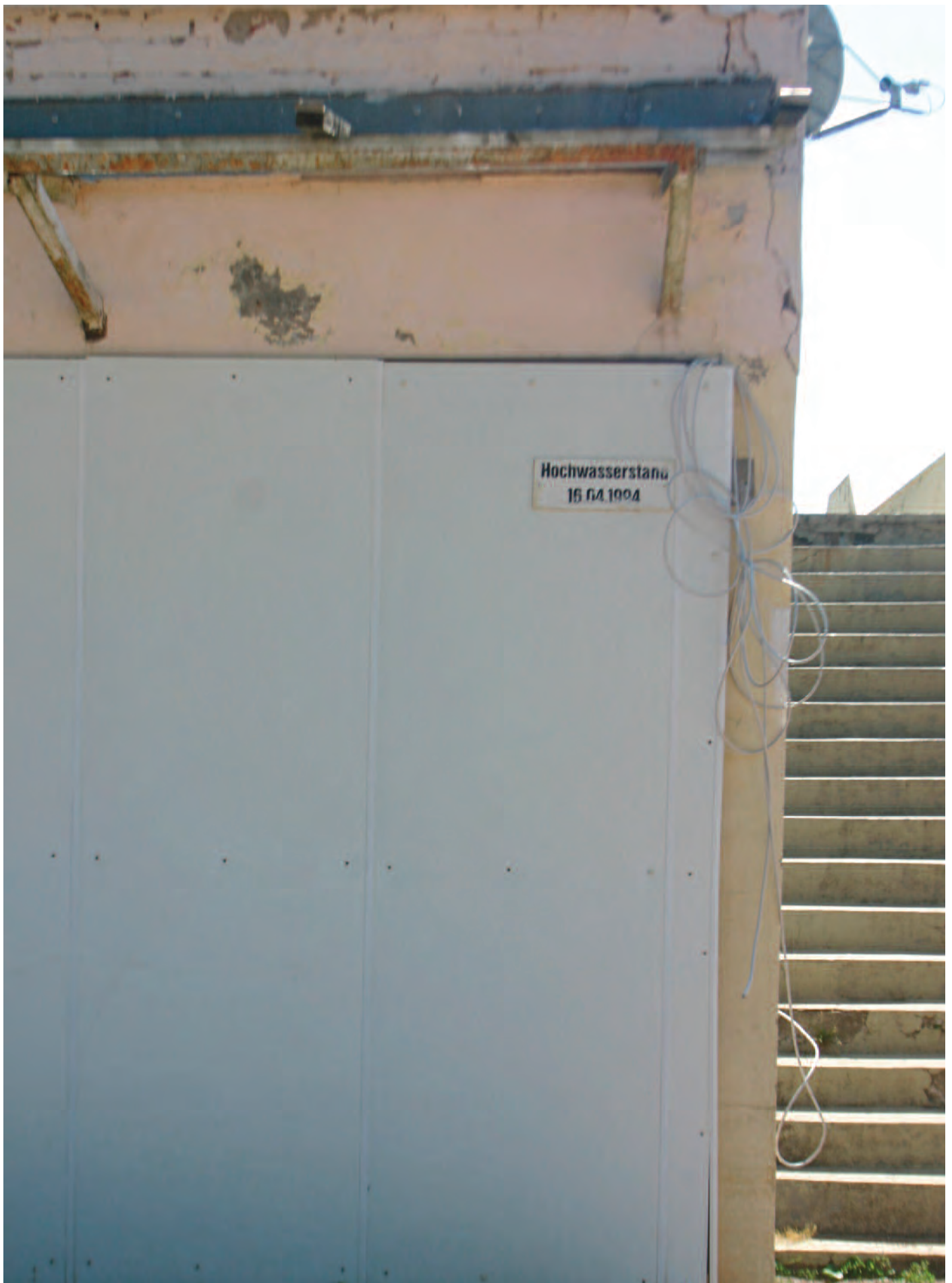
Nr. 12: Galopp-Rennbahn Halle, Haupttribüne, südwestliche Gebäudeecke, HWM vom 16. April 1994