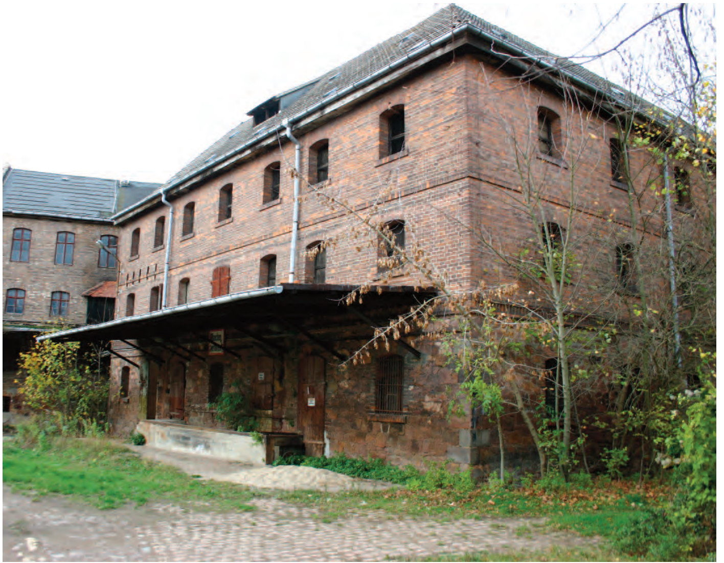
Nr. 1a: Trothaer Mühle; Schleusenstraße 1, 06118 Halle (Saale), Mühlengehöft, Haus 1 (nördlich) Lager, südöstliche Gebäudefront