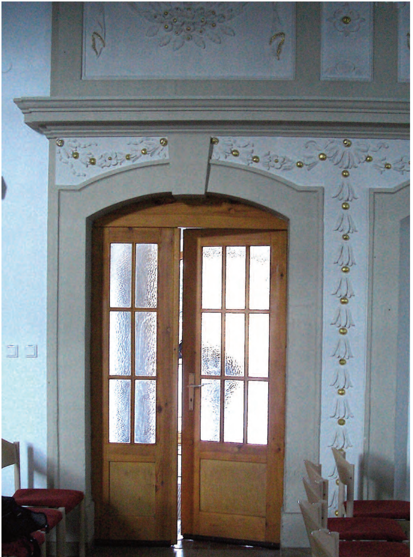
Nr. 9: Evangelische Kirche Passendorf, nördliche Eingangstür zum Kirchenschiff, Türlaibung, vom inneren Kirchenschiff aus gesehen rechts