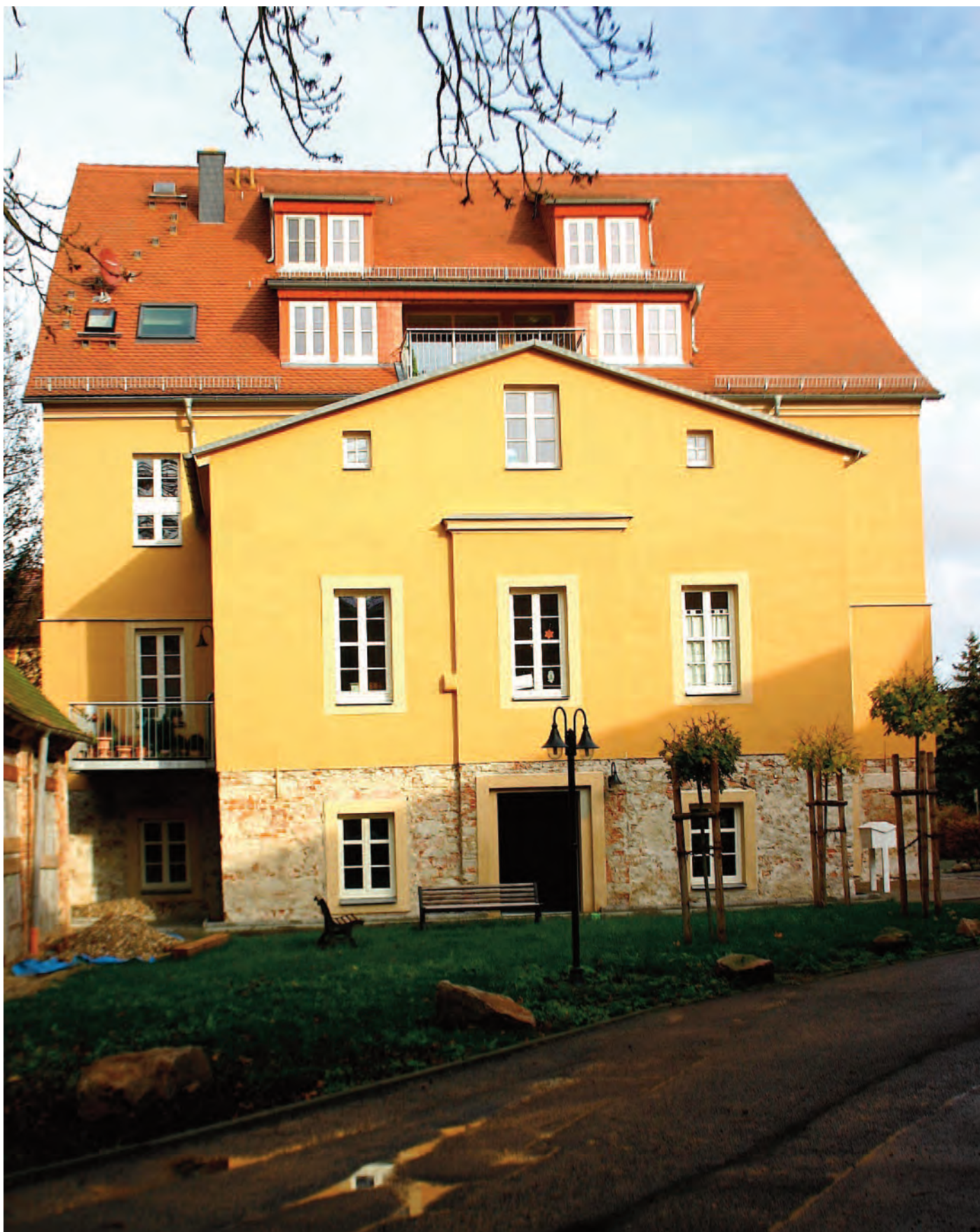
Nr. 7: Wohnhaus, ehemalige Wassermühle des Vorwerks Gimritz; An der Peißnitzinsel 1, 06108 Halle (Saale), Westseite. Umlaufend steinsichtiges Mauerwerk in ca. 2 m Höhe – Wasserschaden des Hochwassers vom Sommer 2013