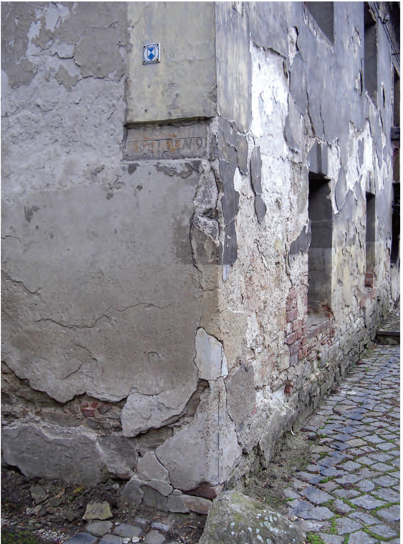
Nr. 6: Steinmühle, Südostecke mit HWM