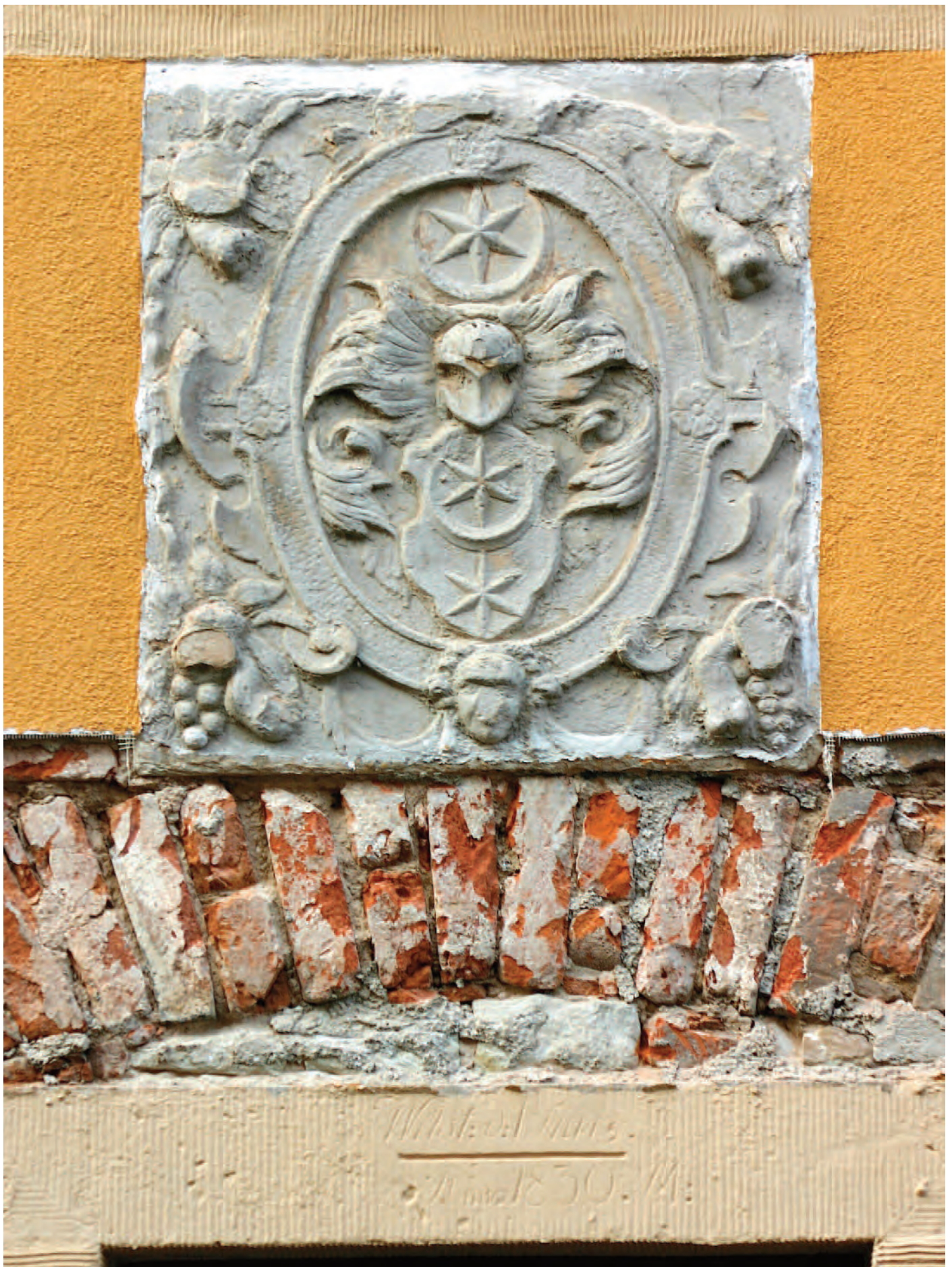
Nr. 7: Wohnhaus, ehemalige Wassermühle des Vorwerks Gimritz, südliche Gebäudefront, Türsturz der südlichen Eingangstür mit HWM vom 1. März 1830; darüber hallesches Ratswappen (teilw. beschädigt), mit Rollwerk und Trauben