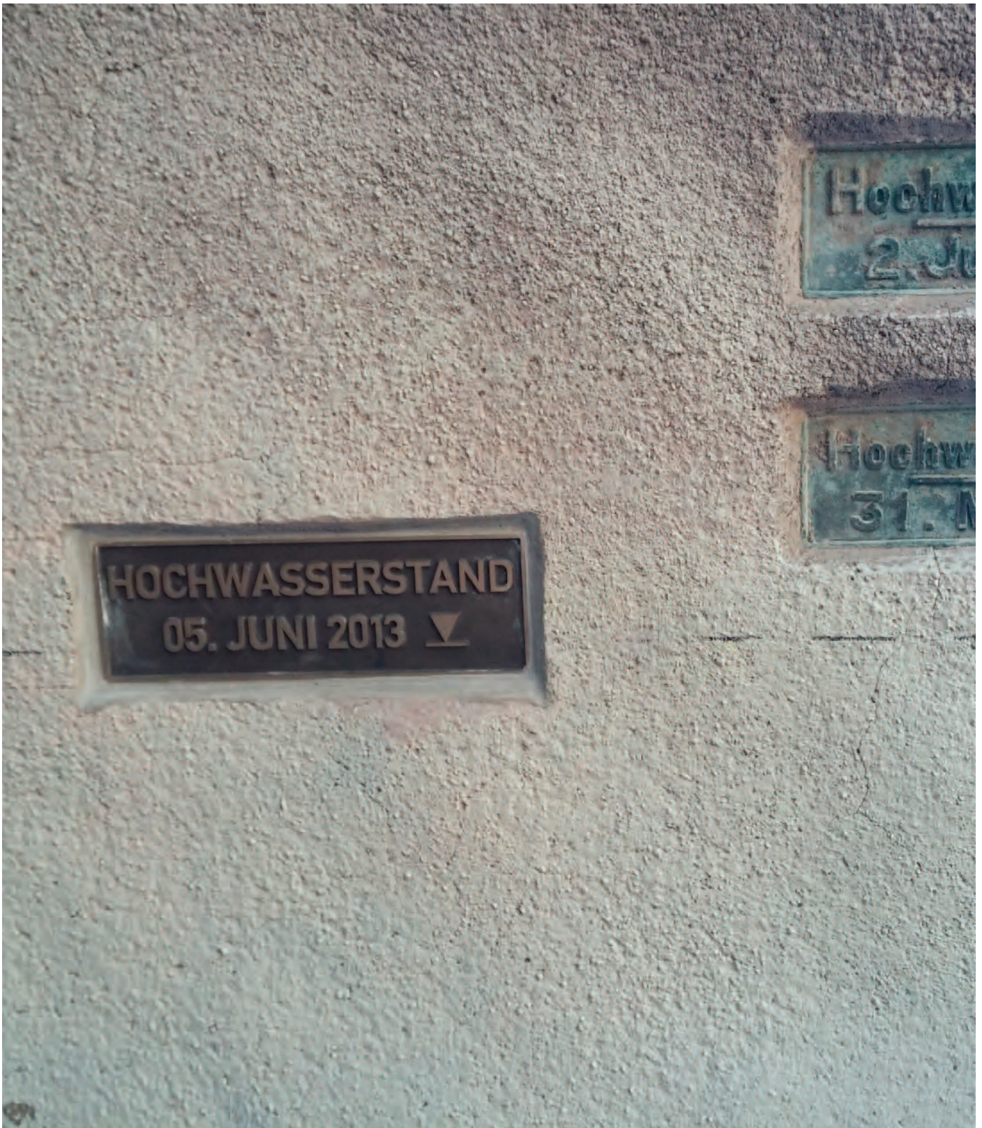
Nr. 3: Giebichensteinbrücke, linkes äußeres Brückensegment, talwärts; HWM 2013, Detailansicht