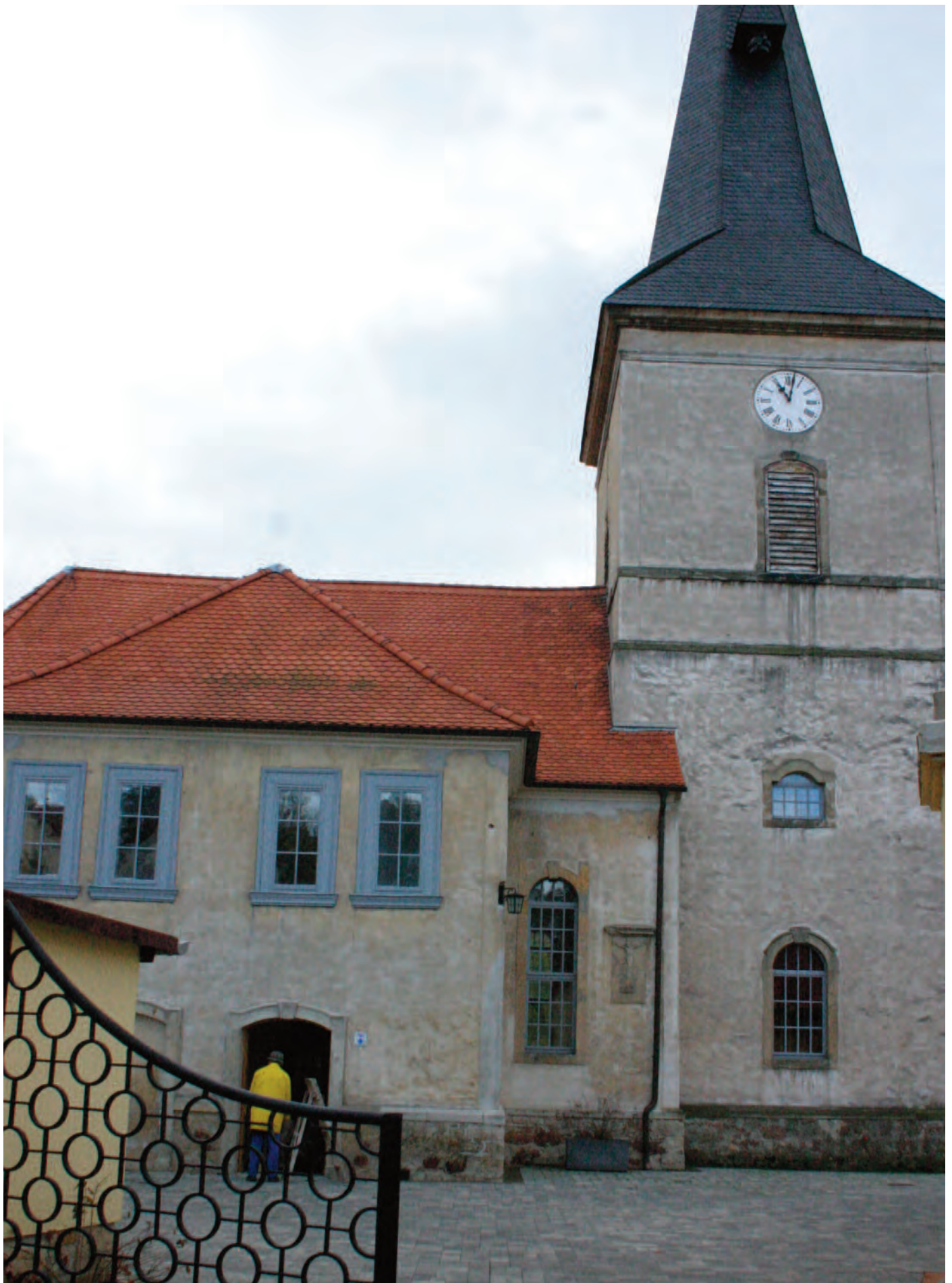
Nr. 9: Evangelische Kirche Passendorf, evang. Pfarramt Halle (Saale); Schulplatz 4, 06124 Halle (Saale).