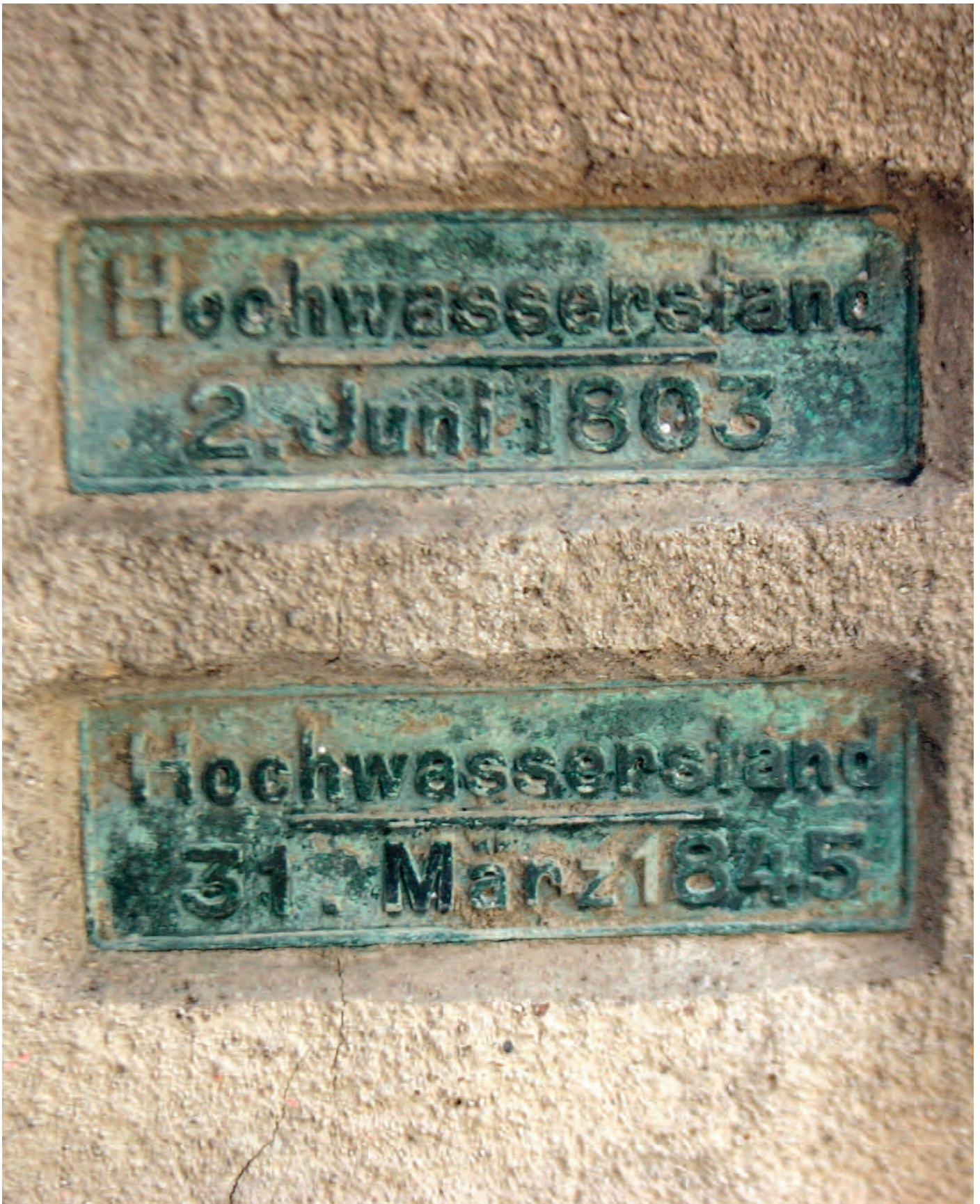
Nr. 3: Giebichensteinbrücke, linkes äußeres Brückensegment, talwärts; zwei HWM, Detailansicht