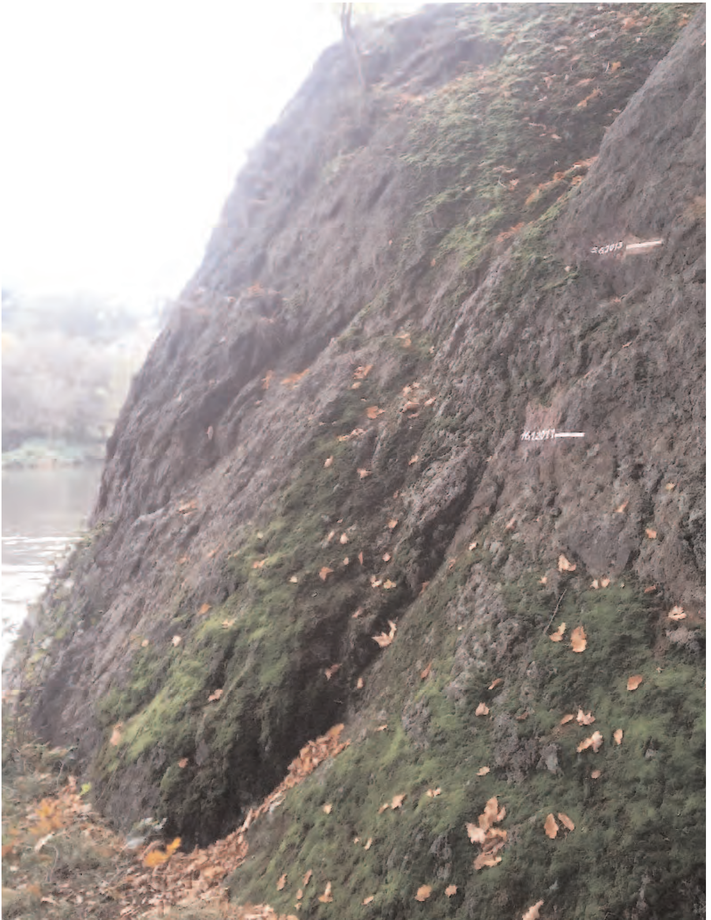
Nr. 5: Felsen Klausberge, Giebichenstein, HWM 16. Januar 2011 und 5. Juni 2013