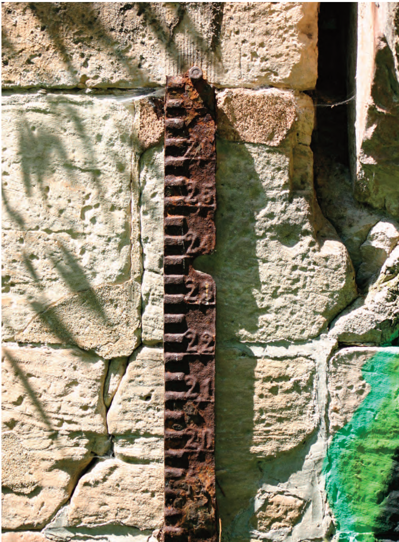
Nr. 13: Eisenbahnbrücke, Kasseler Bahn, Binnenpegel, Südseite, rechter Brückenpfeiler talwärts