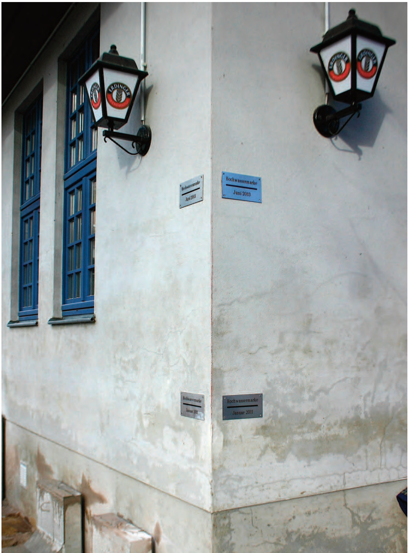
Nr. 2b: Gasthaus »Krug zum Grünen Kranze«, nördlicher Gebäudeteil, Innenhof Südostecke, HWM 2011 und 2013