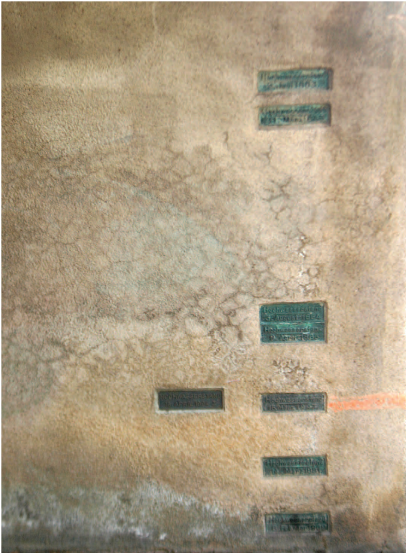
Nr. 3: Giebichensteinbrücke, linkes äußeres Brückensegment, talwärts rechte Seite des inneren Brückenbogens, HWM