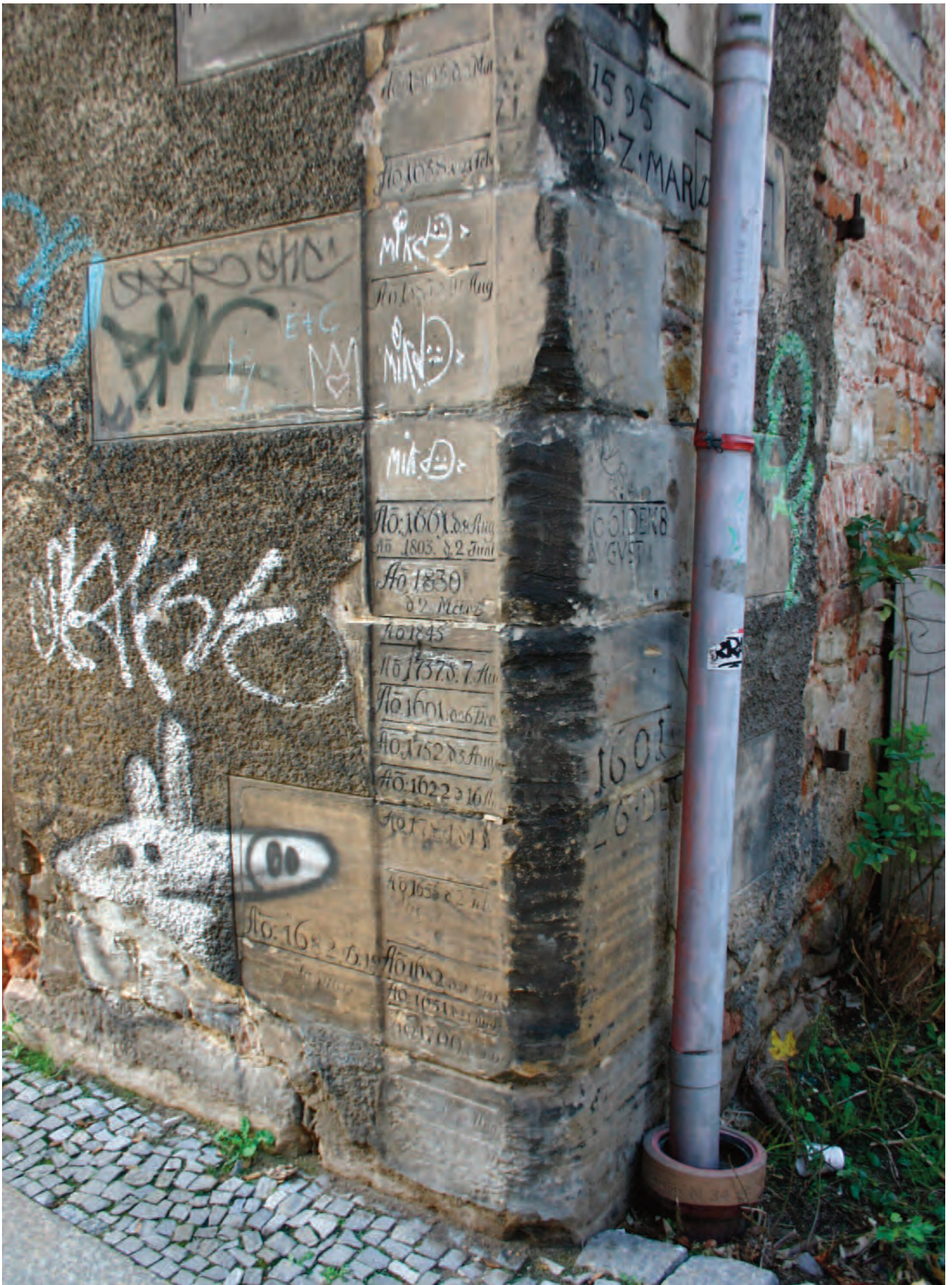
Nr. 11: Neumühle, südöstliche Eckquadrierung, Ost-Westseite mit HWM, Ausschnitt