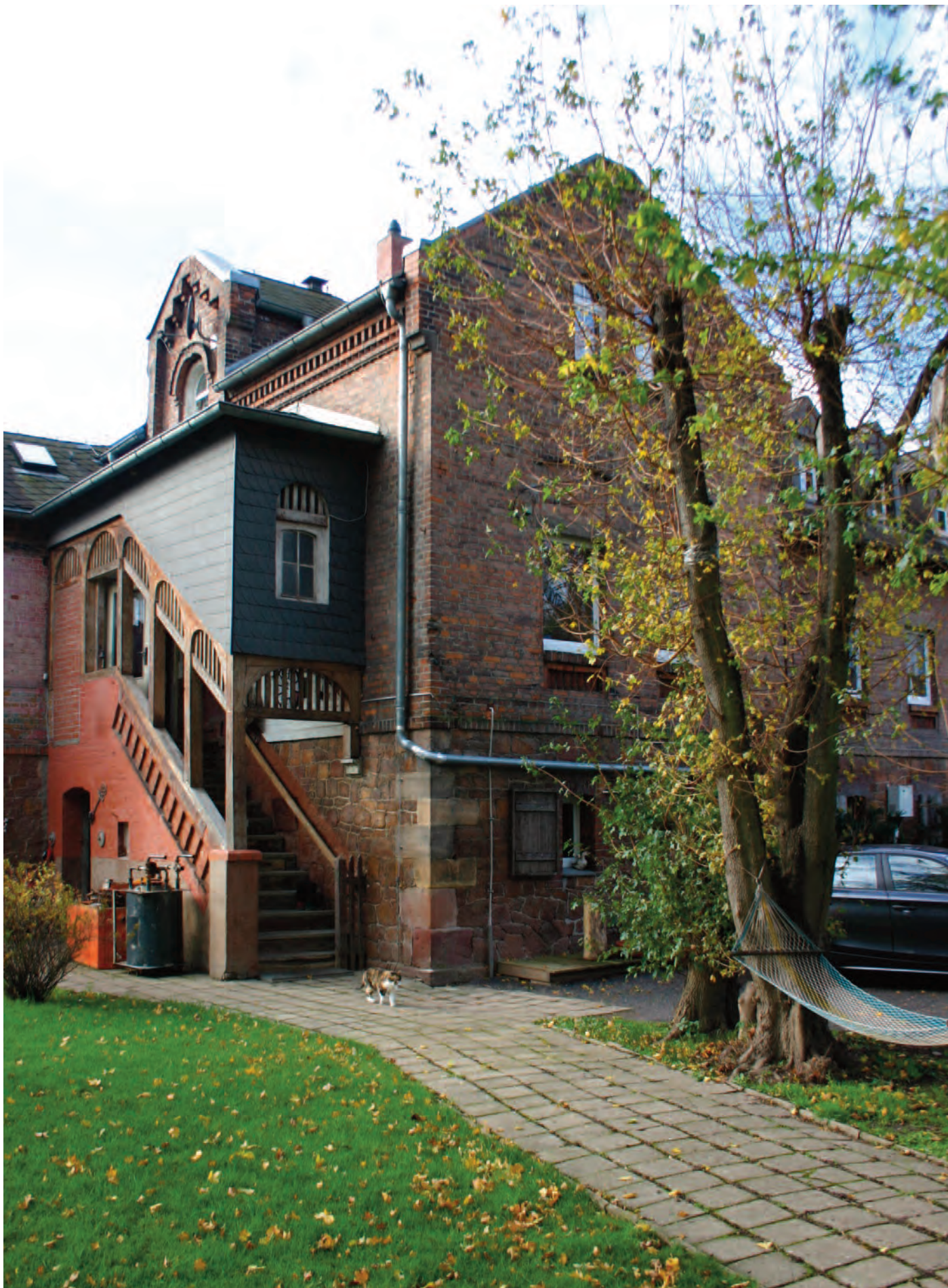
Nr. 8: Wohnhaus Schleuse Gimritz; An der Schleuse 1, 06108 Halle (Saale), HWM an der Süd- und Südwestecke