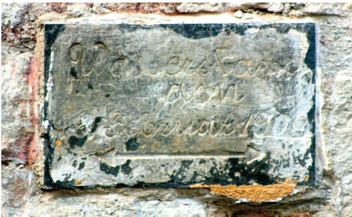
Nr. 7: Wohnhaus, ehemalige Wassermühle des Vorwerks Gimritz, südliche Gebäudeseite zwei HWM, Detailansicht