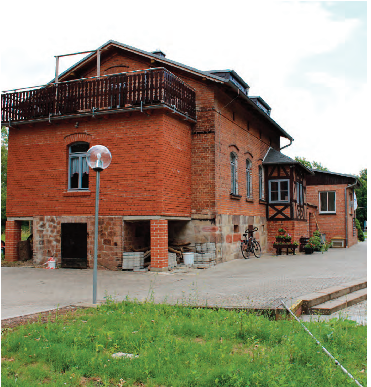
Nr. 1d: Trothaer Schleuse, Schleusenhaus, nordwestliche Gebäudeecke