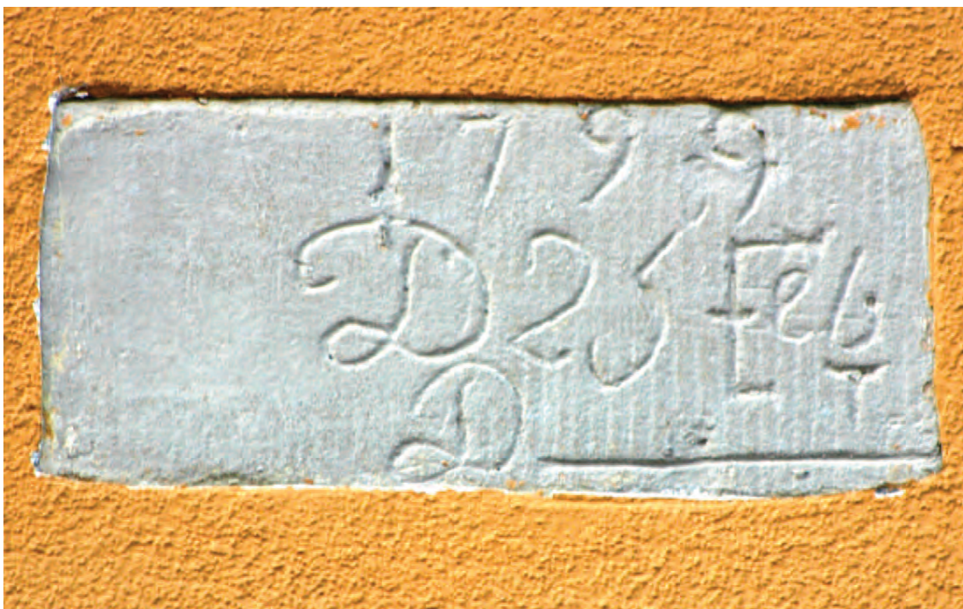
Nr. 7: Wohnhaus, ehemalige Wassermühle des Vorwerks Gimritz, südliche Gebäudefront, Türsturz der südlichen Eingangstür mit HWM vom 1. März 1830, Detailansicht; darunter von der südlichen Gebäudeseite (Südostecke, unterhalb des rechten Fensterstockes) HWM vom 25. Februar 1799, Detailansicht