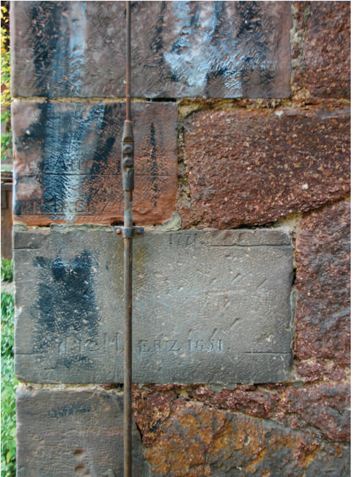
Nr. 1a: Trothaer Mühle, Haus 1 (nördlich) Lager, südöstliche Gebäudeecke, Eckquadrierung, Ostseite mit HWM, Detailansicht (Ausschnitt)