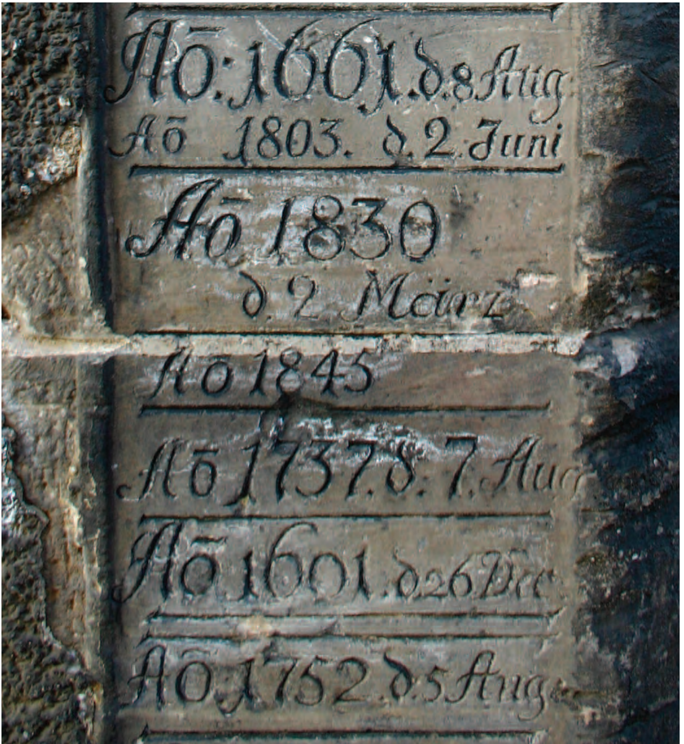
Hochwassermarken im Stadtgebiet Halle (Saale) Fotodokumentation