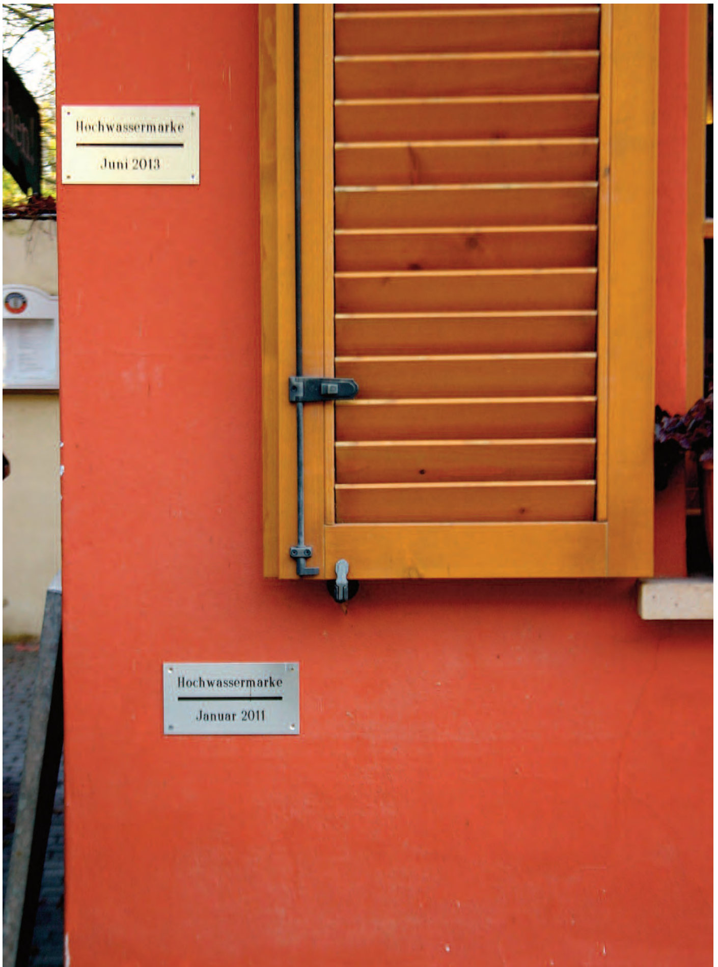
Nr. 2a: Gasthaus »Krug zum Grünen Kranze«, westliche Außenwand, nord-westliche Ecke, HWM 2011 und 2013