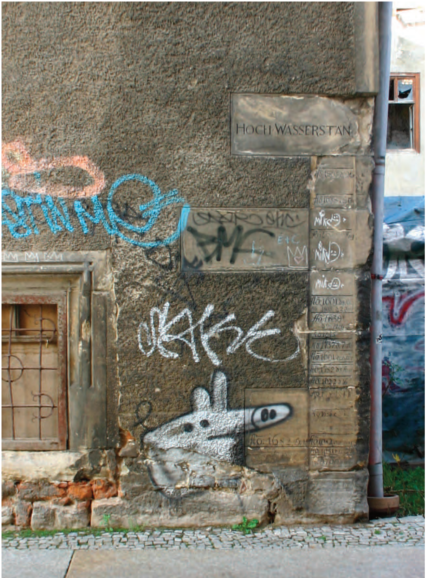
Nr. 11: Neumühle, südöstliche Eckquadrierung, Südseite mit HWM