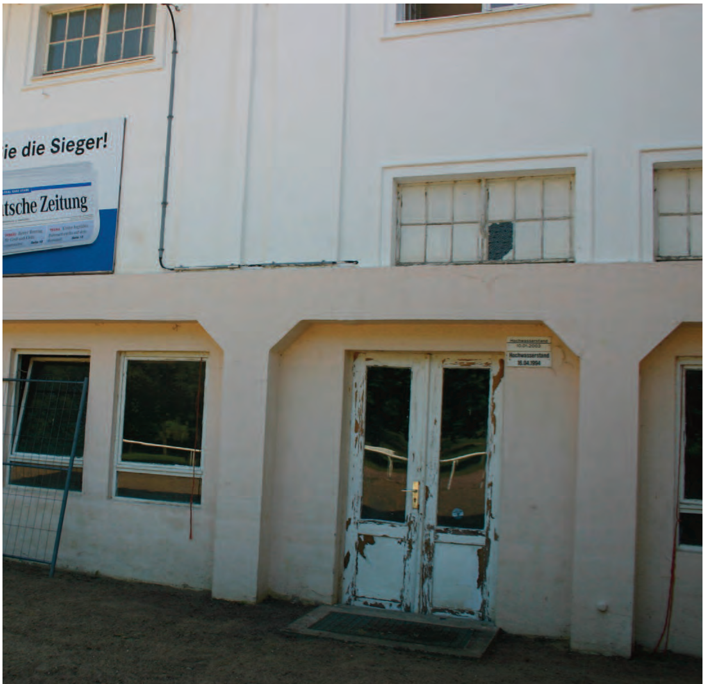
Nr. 12: Galopp-Rennbahn Halle, Haupttribüne, Westseite Eingangstür, HWM vom 16. April 1994 und 10. Januar 2003