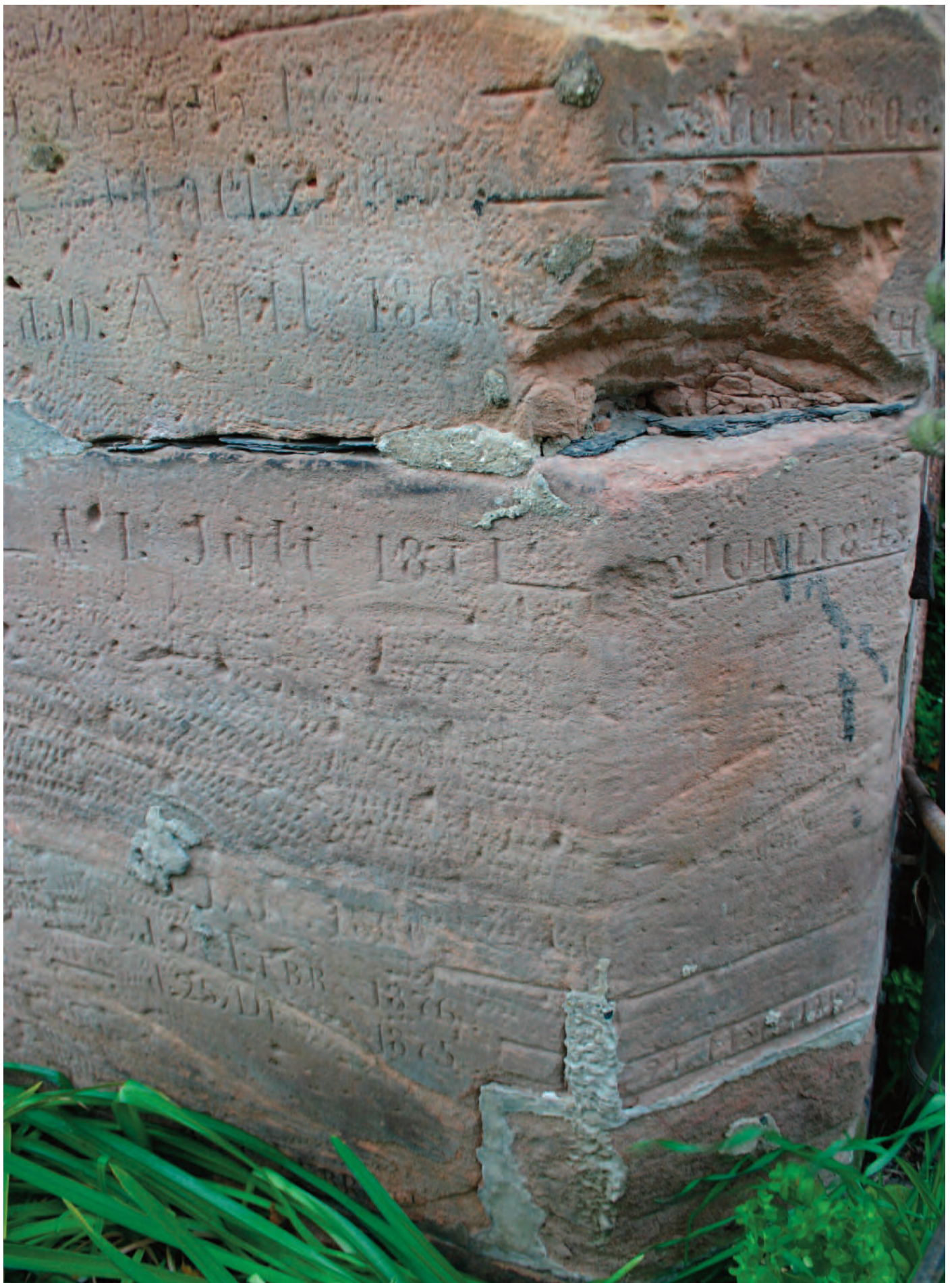
Nr. 1c: Trothaer Mühle, Haus 3, Wohnhaus, nordwestliche Gebäudeecke, HWM, Detailansicht (Ausschnitt)