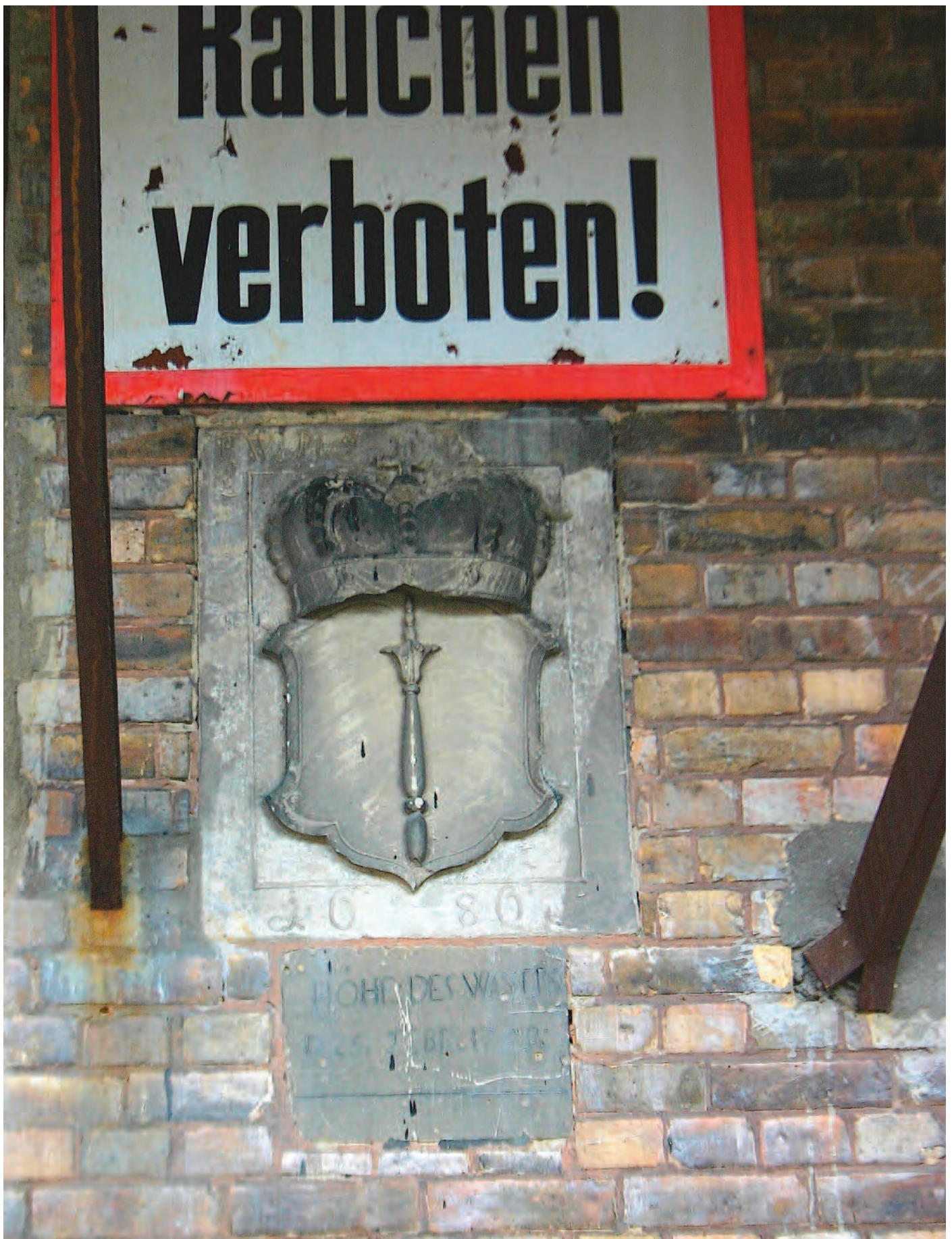
Nr. 1b: Trothaer Mühle, Haus 2 (westlich) Mühle, östliche Gebäudeseite (Traufseite) unter Vordach, kurfürstlich brandenburg-preußisches Wappen (Kuruhut und Zepter), darunter HWM vom 25. Februar 1799