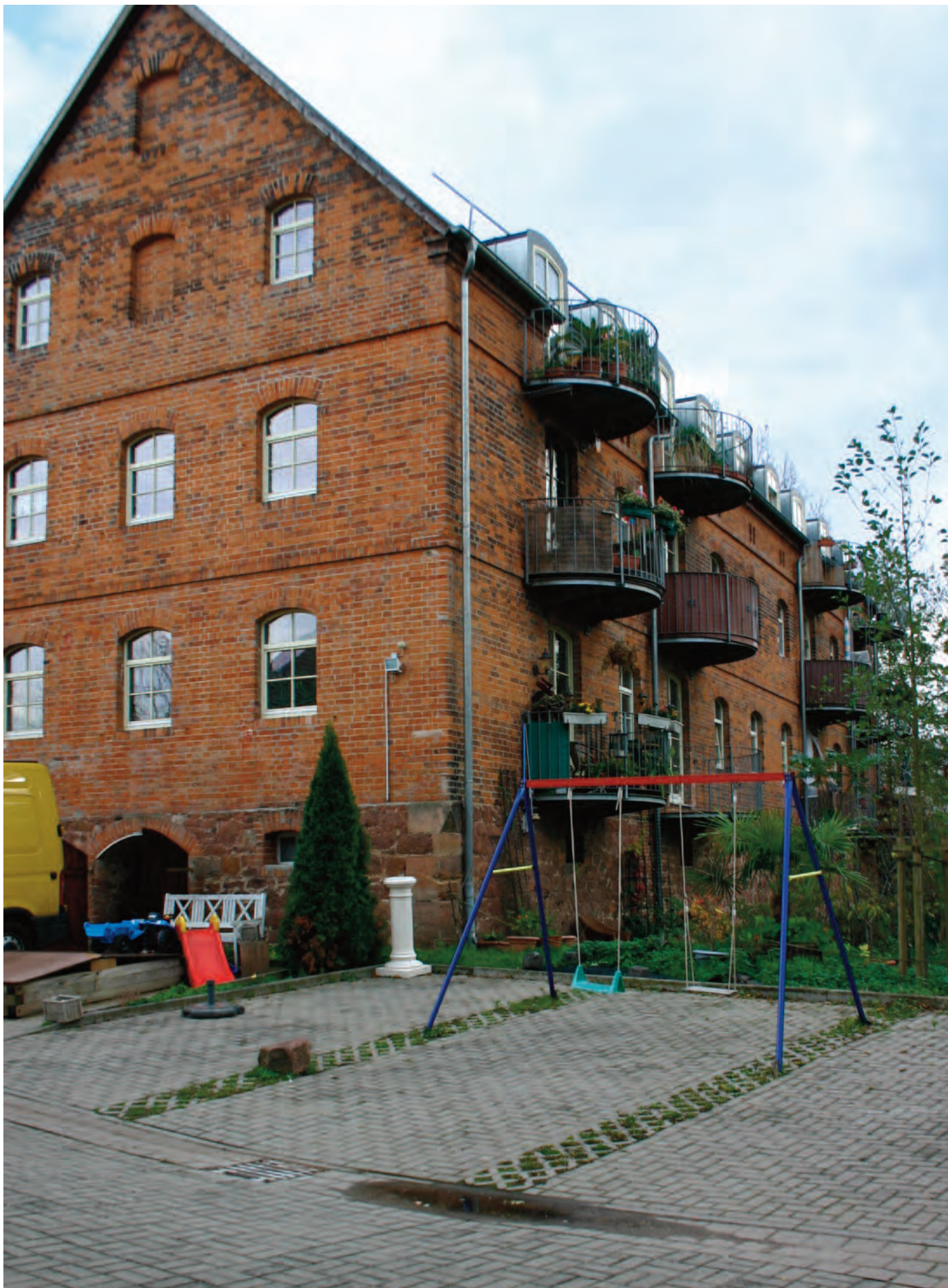
Nr. 1c: Trothaer Mühle, Haus 3 (südlich) Wohnhaus, nördliche Giebelwand