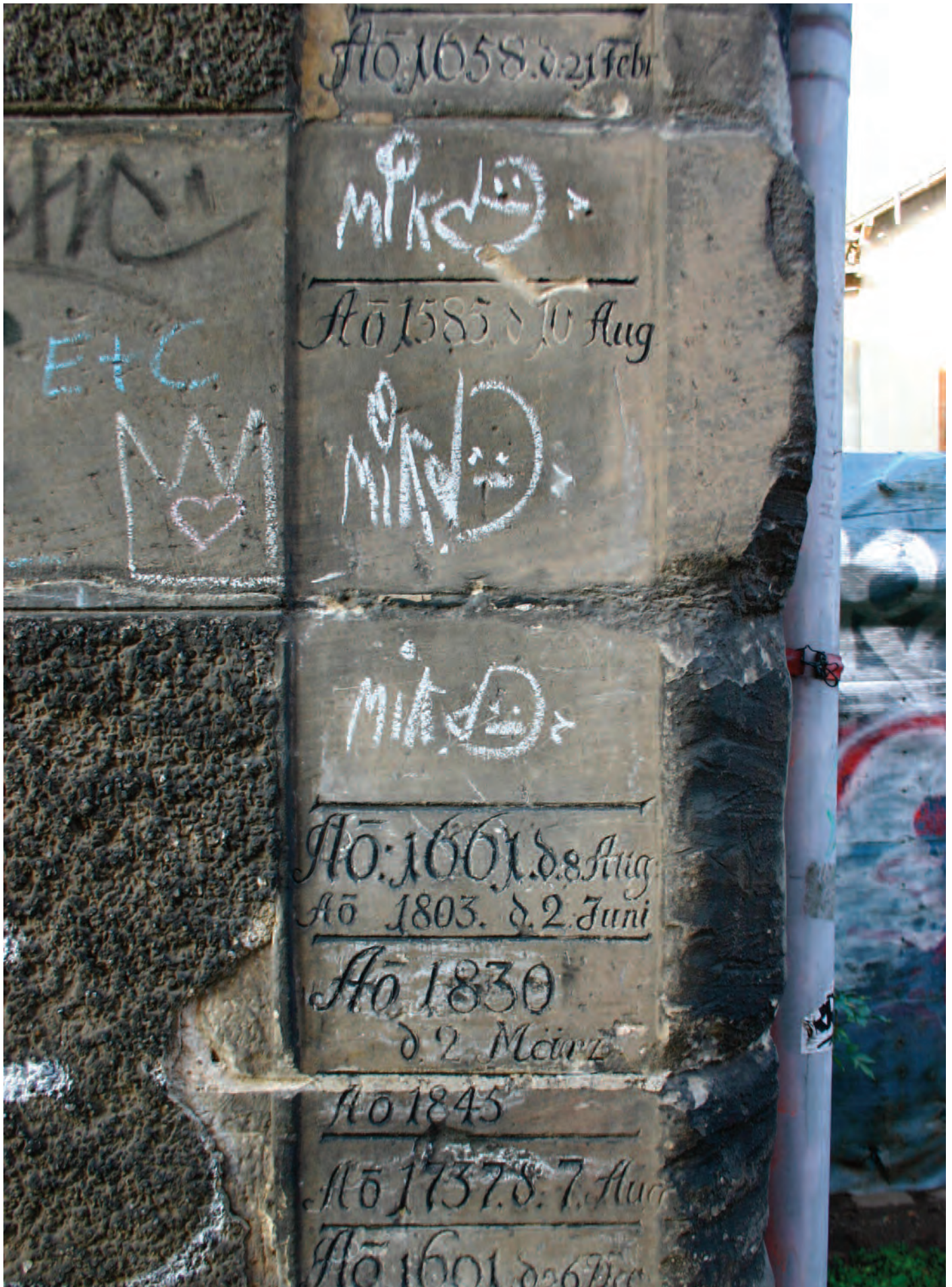
Nr. 11: Neumühle, südöstliche Eckquadrierung, Westseite mit HWM, Detailansicht