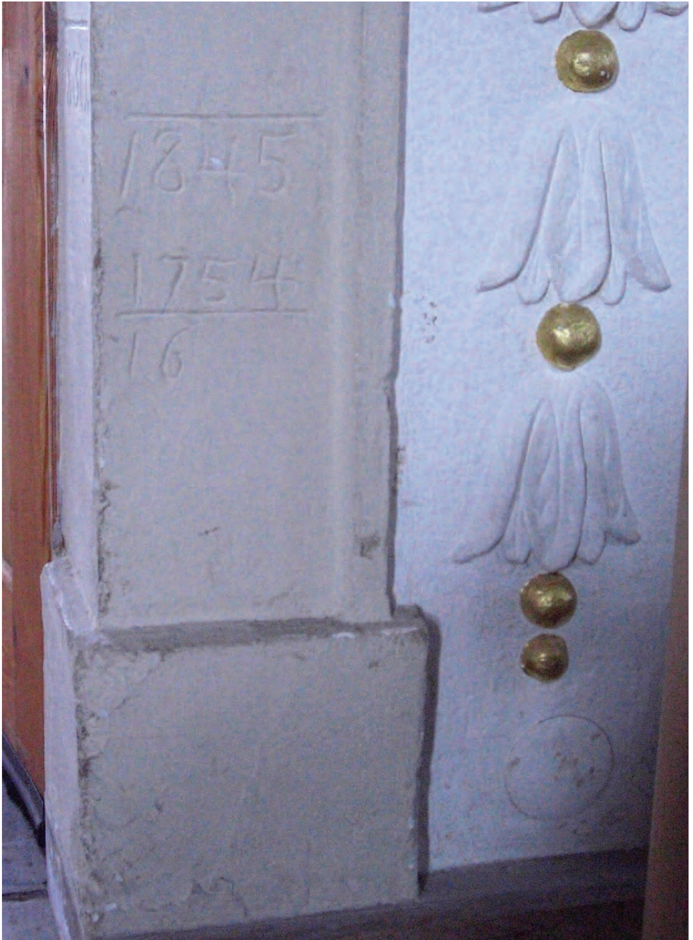
Nr. 9: Evangelische Kirche Passendorf, nördliche Eingangstür zum Kirchenschiff, Türlaibung, drei HWM, Ausschnitt