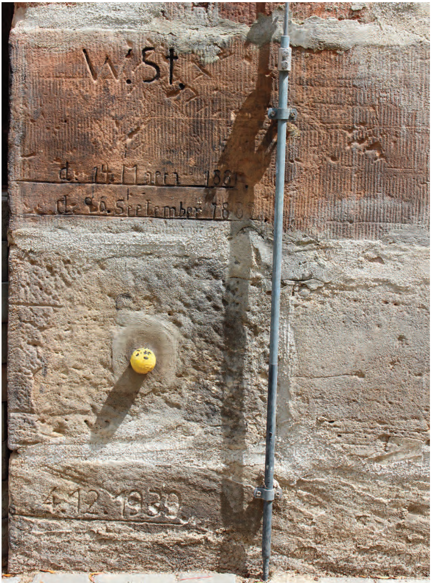
Nr. 1d: Trothaer Schleuse, Schleusenhaus, westliche Gebäudeseite, HWM, Detailansicht (Ausschnitt)