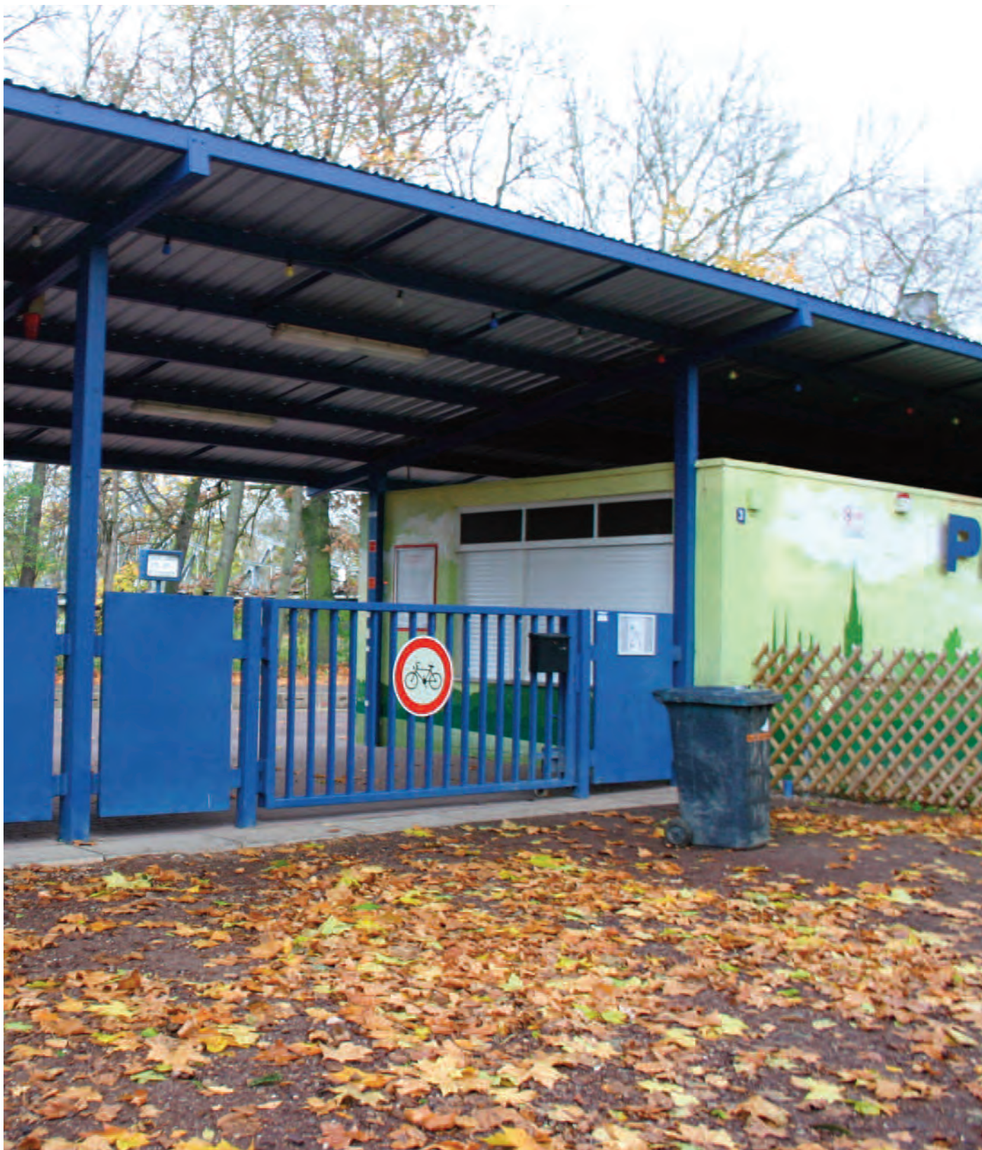
Nr. 10: Parkeisenbahn - Peißnitzexpress; Peißnitzinsel 3, 06108 Halle (Saale), Bahnhof Peißnitzbrücke