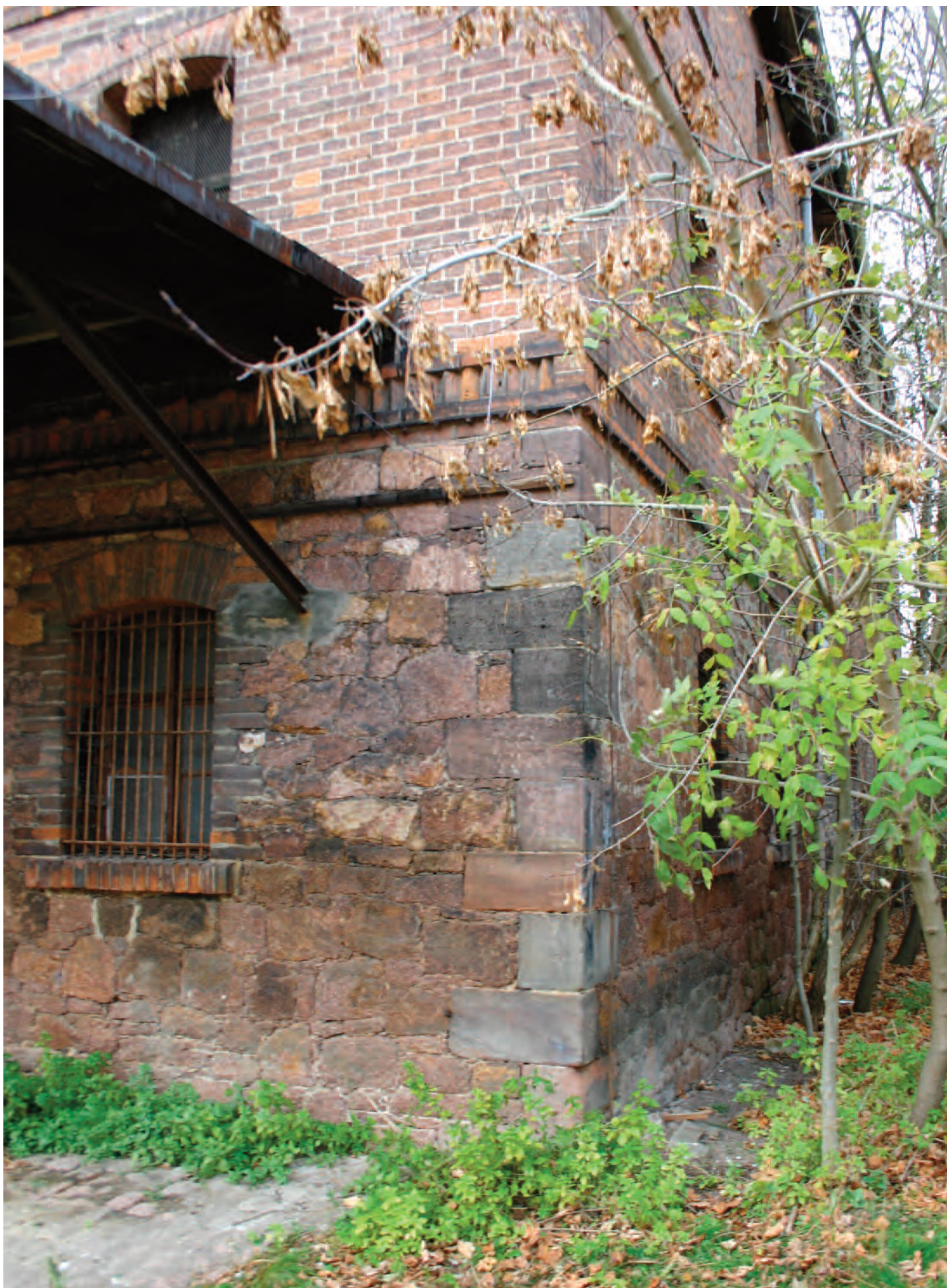
Nr. 1a: Trothaer Mühle, Haus 1 (nördlich) Lager, südöstliche Gebäudeecke, Eckquadrierung mit Hochwassermarken (HWM)