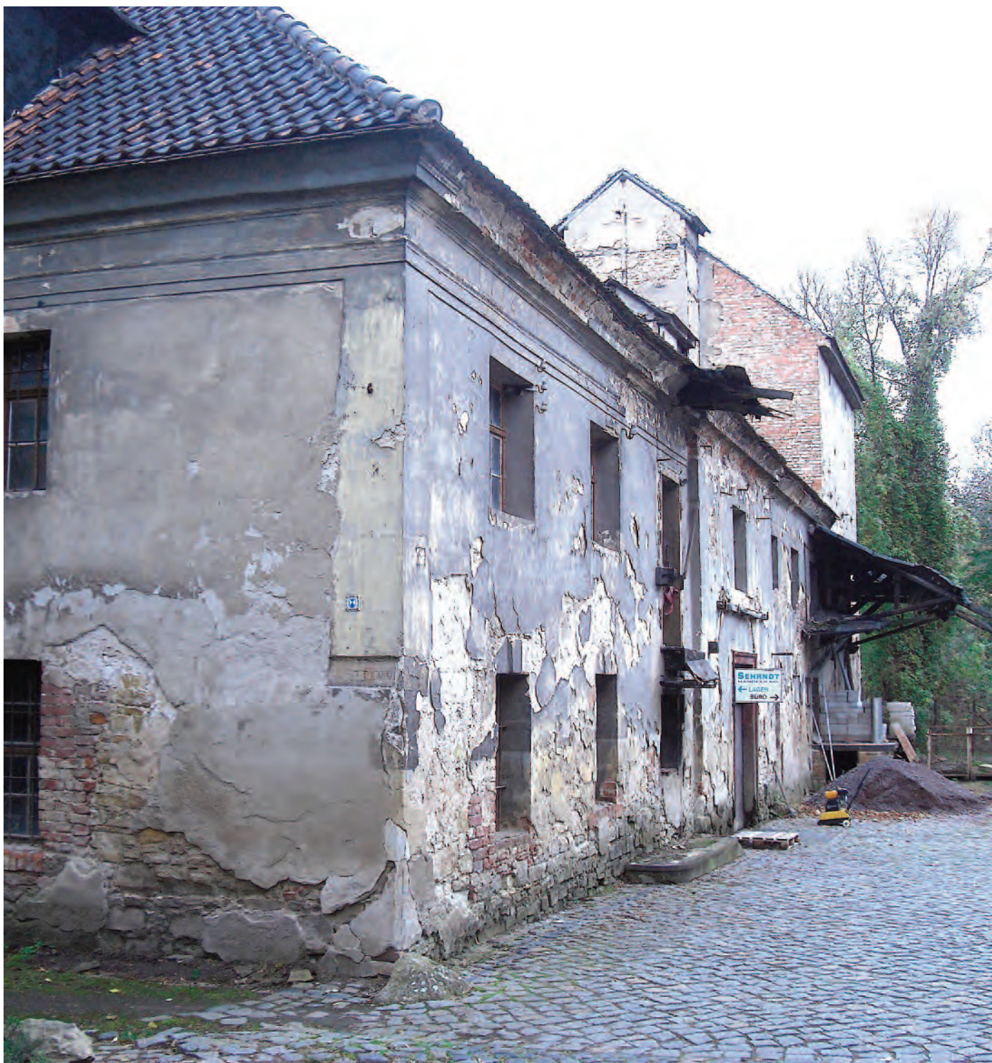
Nr. 6: Steinmühle; An der Steinmühle 1, o61o8 Halle (Saale), Südostecke und östliche Gebäudefront, traufseitig