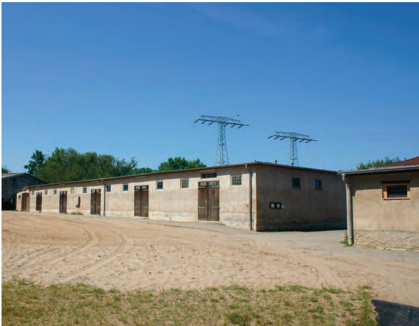
Nr. 12: Galopp-Rennbahn Halle, Wirtschaftsgebäude