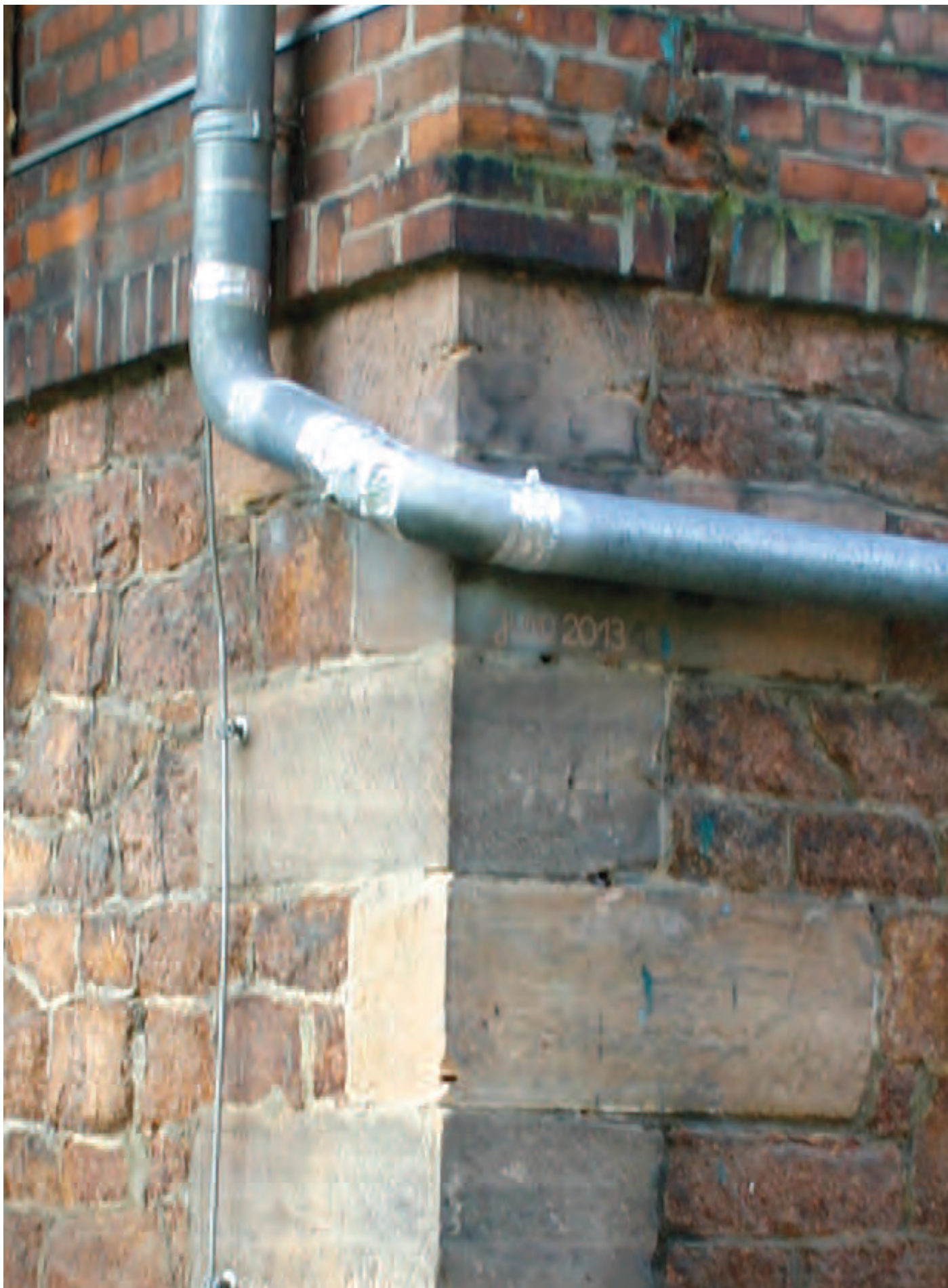
Nr. 8: Wohnhaus Schleuse Gimritz, Südostecke/Ostseite HWM vom Juni 2013, Ausschnitt