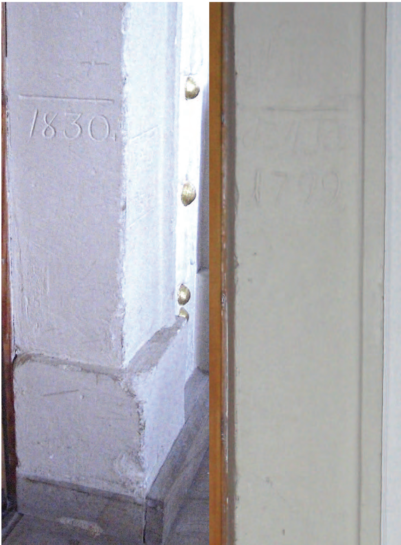
Nr. 9: Evangelische Kirche Passendorf, nördliche Eingangstür zum Kircheschiff, Türlaibung innen mit HWM 1830 und außen 24. Februar 1799, Ausschnitt