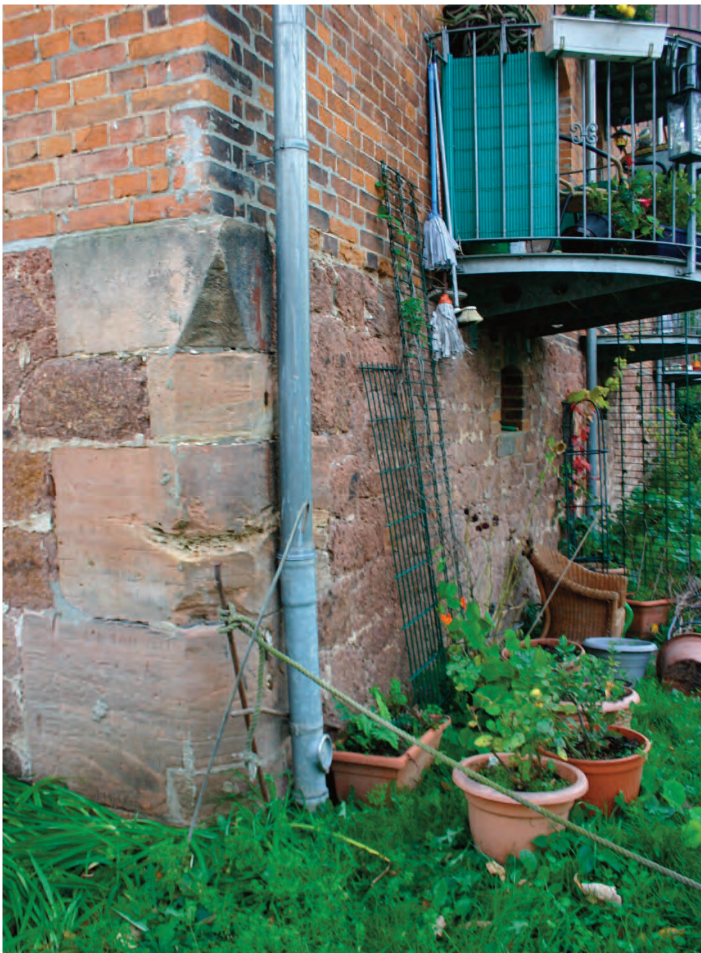
Nr. 1c: Trothaer Mühle, Haus 3, Wohnhaus, nordwestliche Gebäudeecke mit Hochwassermarken