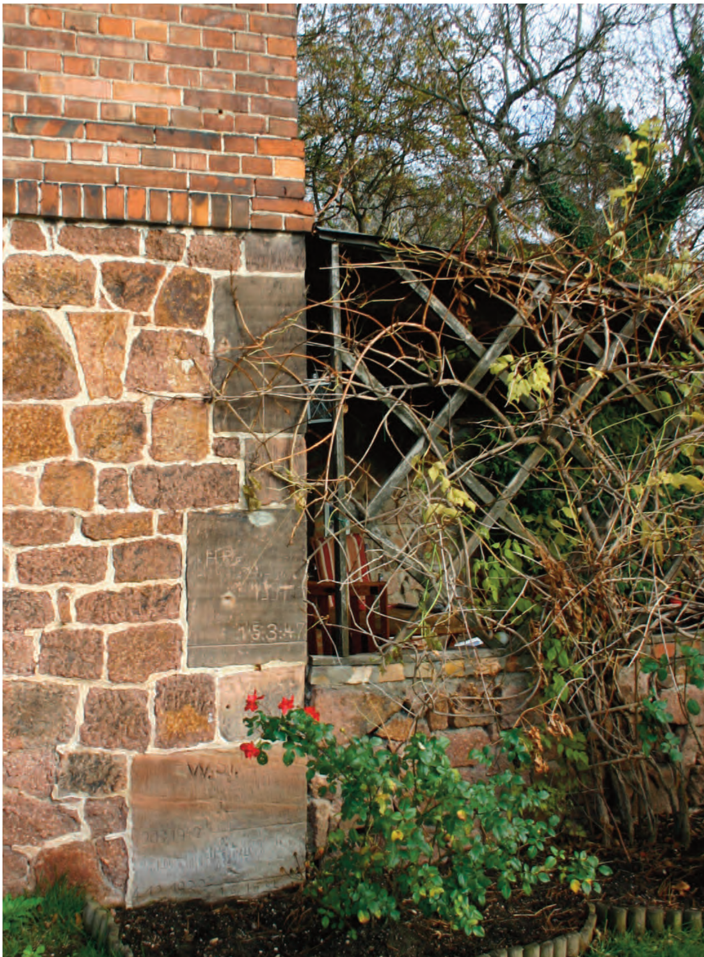
Nr. 8: Wohnhaus Schleuse Gimritz, Südwestecke Westseite HWM