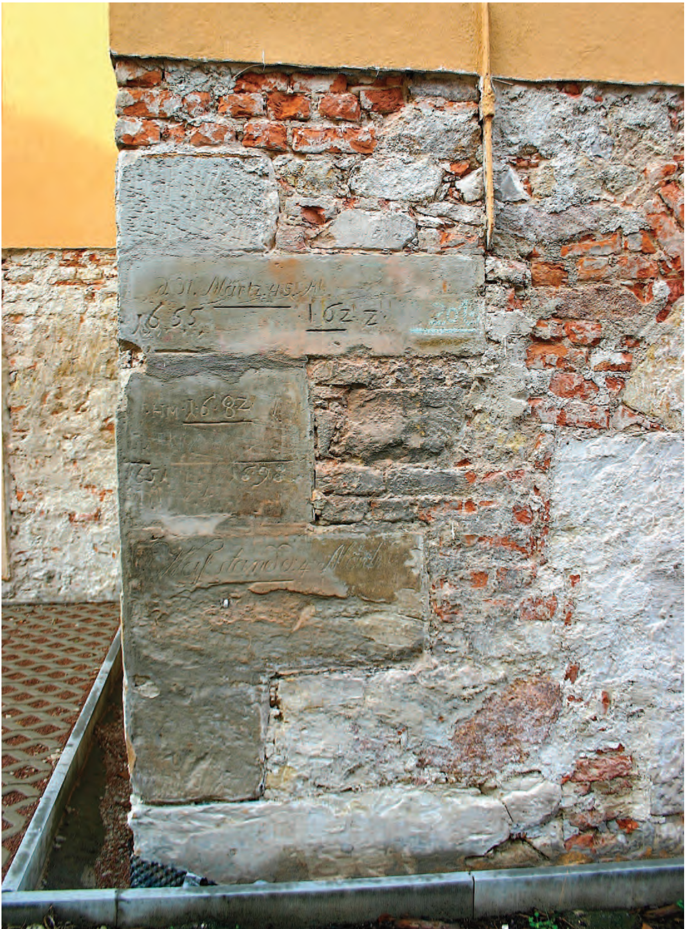
Nr. 7: Wohnhaus, ehemalige Wassermühle des Vorwerks Gimritz, Südwestecke, Eckquadrierung mit acht Hochwassermarken