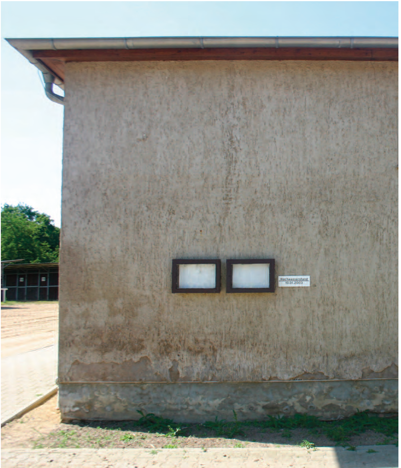
Nr. 12: Galopp-Rennbahn Halle, Wirtschaftsgebäude, Nordseite, HWM vom 10. Januar 2003