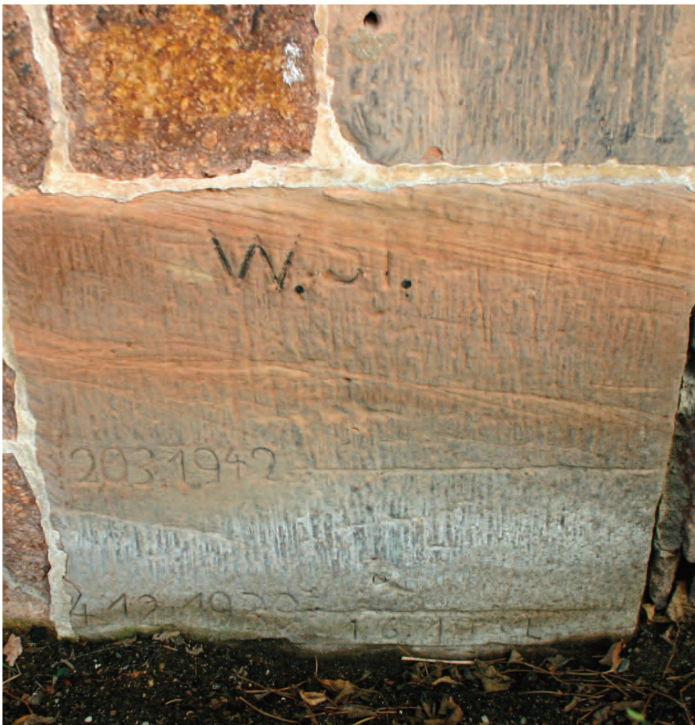
Nr. 8: Wohnhaus Schleuse Gimritz, Südwestecke Westseite HWM, Detailansicht