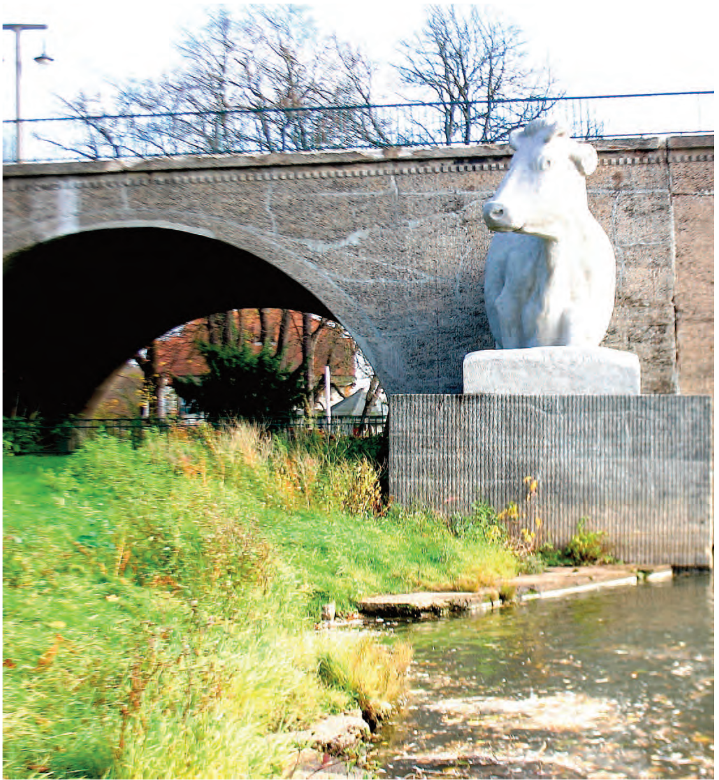
Nr. 3: Giebichensteinbrücke, linkes äußeres Brückensegment, talwärts; Talstraße, 06120 Halle (Saale)