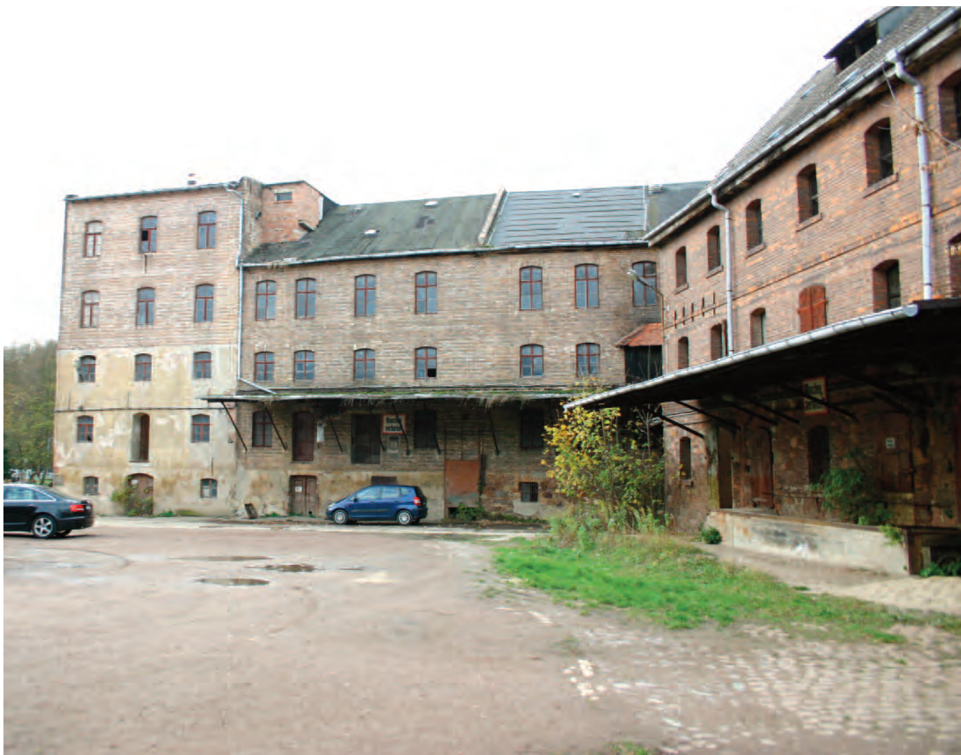
Nr. 1b: Trothaer Mühle, Haus 2 (westlich) Mühle, östliche Gebäudeseite