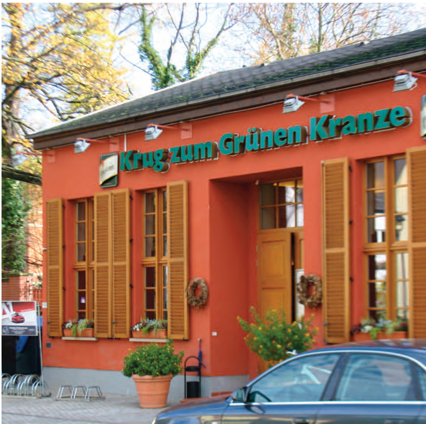
Nr. 2: Gasthaus »Krug zum Grünen Kranze«; Talstraße 37, 06120 Halle (Saale)