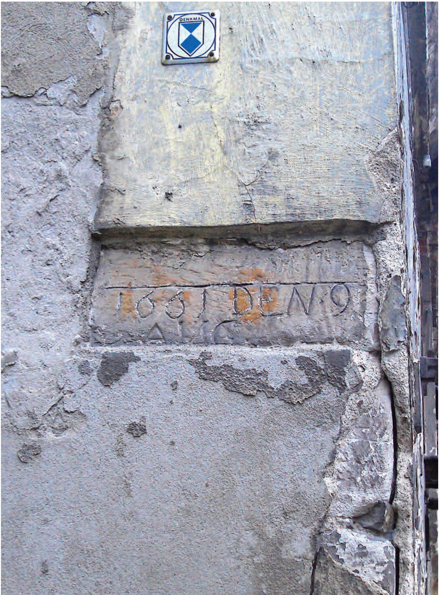
Nr. 6: Steinmühle, Südostecke mit HWM vom 9. August 1661, Detailansicht