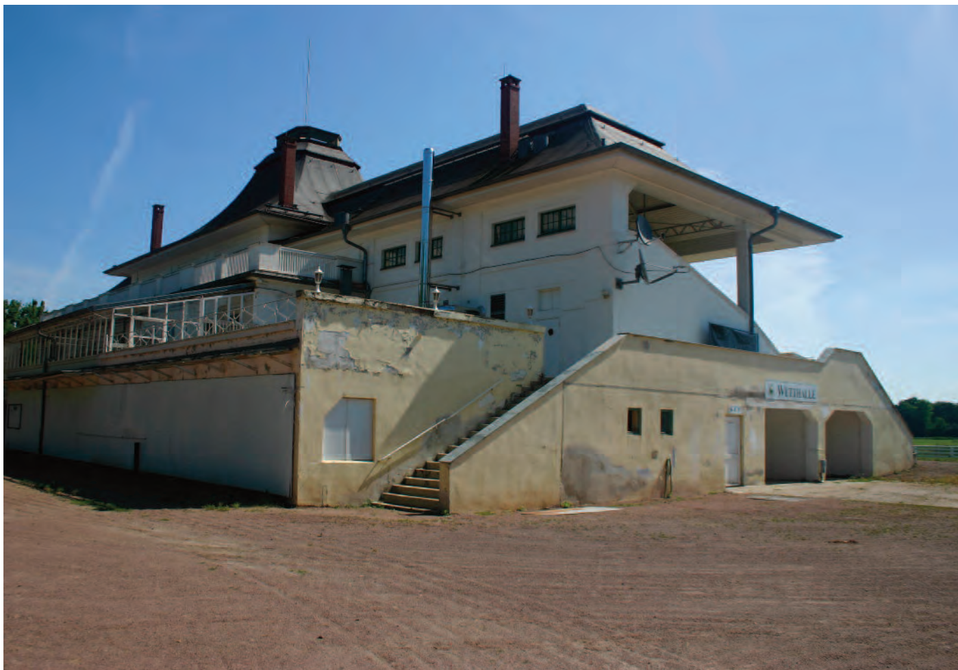
Nr. 12: Galopp-Rennbahn Halle, Haupttribüne, südwestliche Gebäudeecke, o6124 Halle (Saale), Passendorfer Wiesen 1