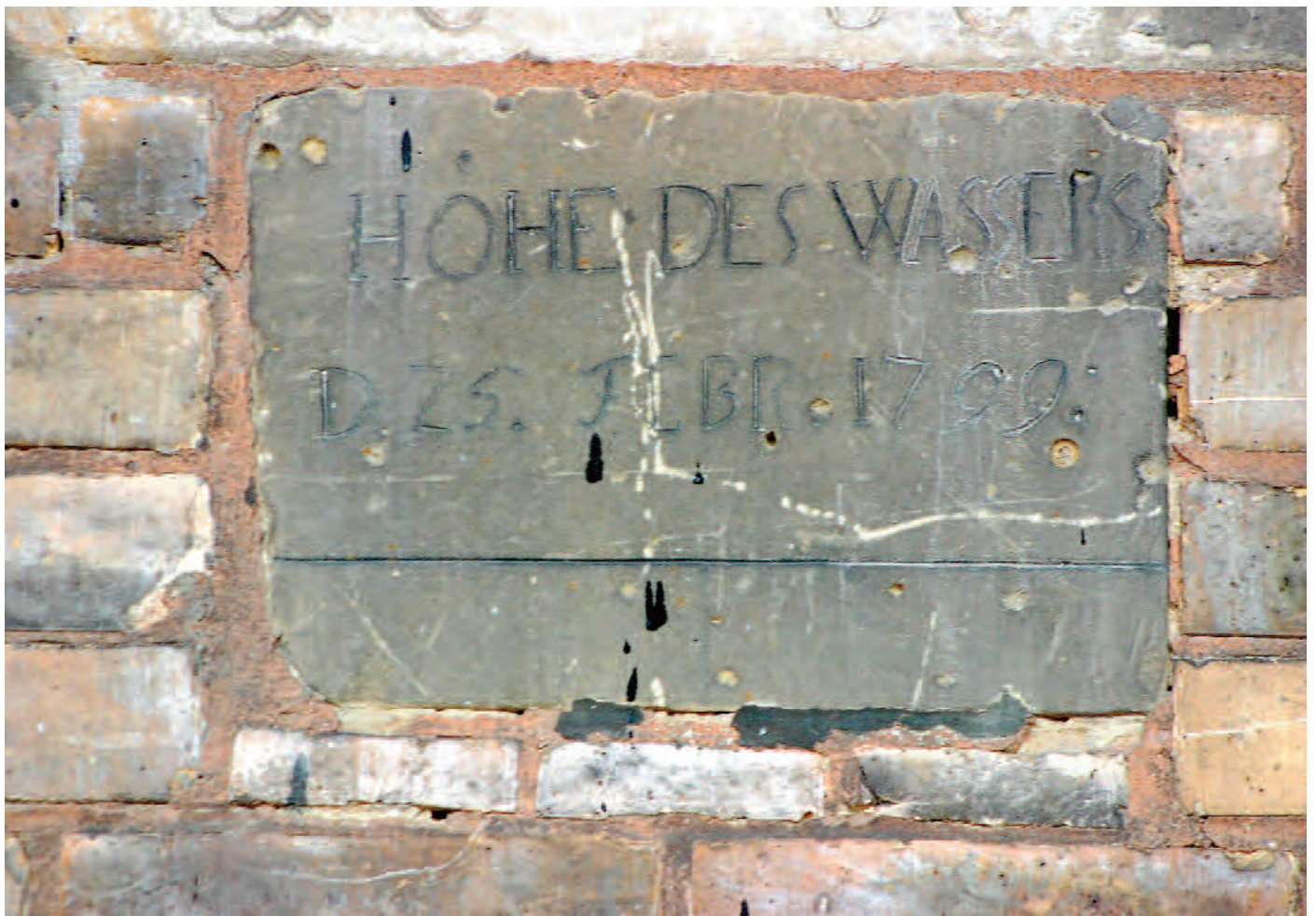
Nr. 1b: Trothaer Mühle, Haus 2 (westlich) Mühle, östliche Gebäudeseite, HWM vom 25. Februar 1799