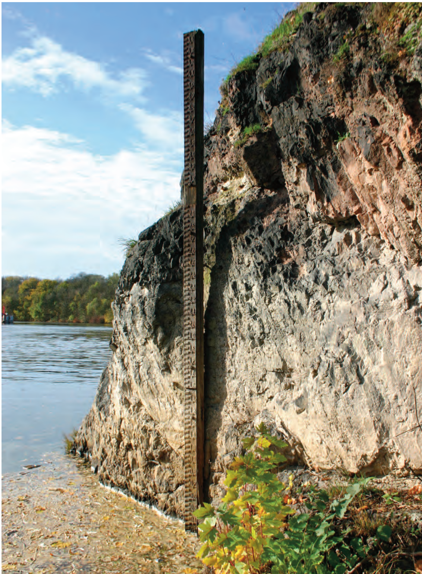
Nr. 4: Pegellatte (Binnenpegel/Lattenpegel, Gußeisen), talwärts, linksseitiges Ufer (Kröllwitz), unterhalb des Kefersteinschen Felsens