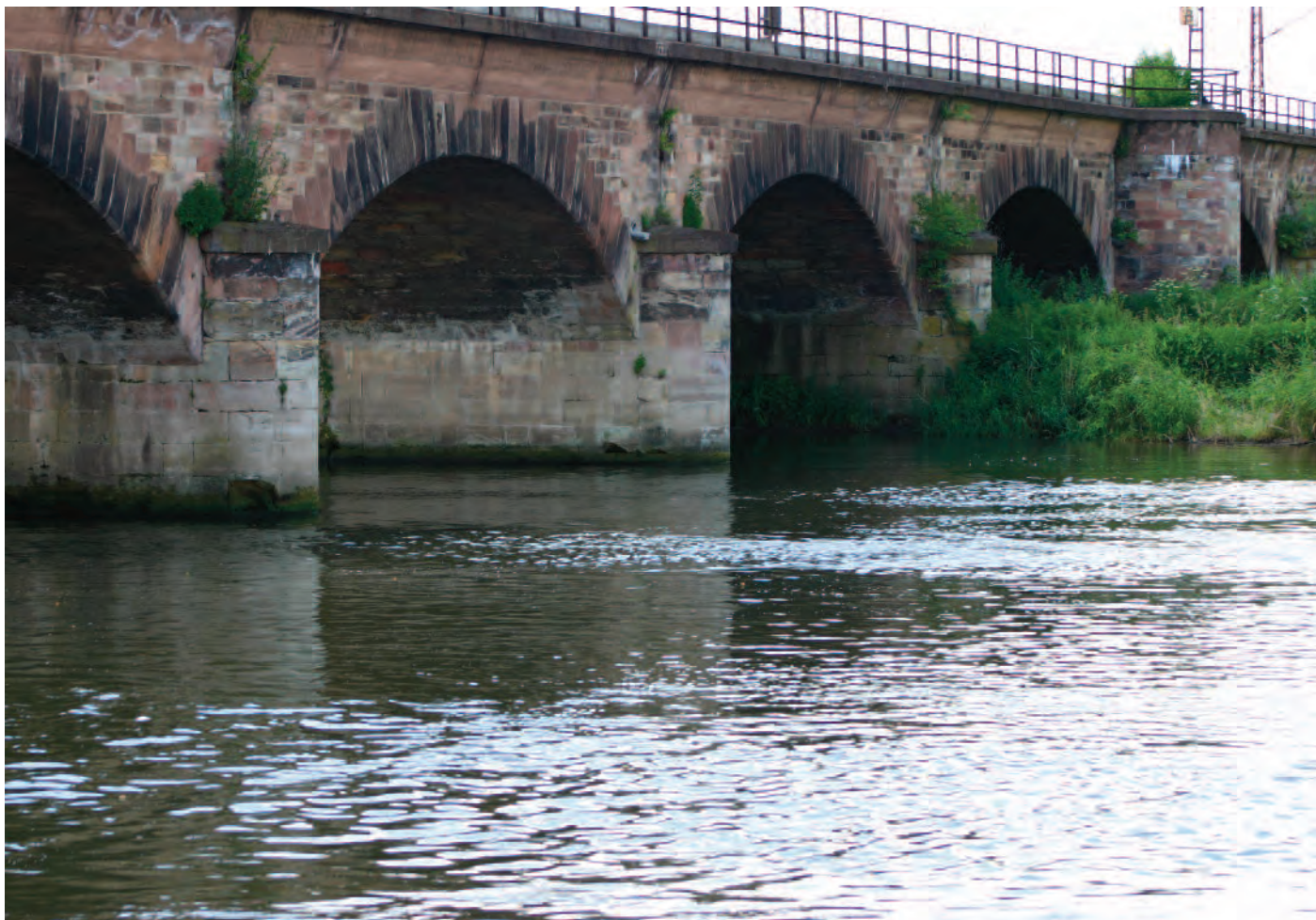
Nr. 13: Eisenbahnbrücke, Kasseler Bahn, Nordseite