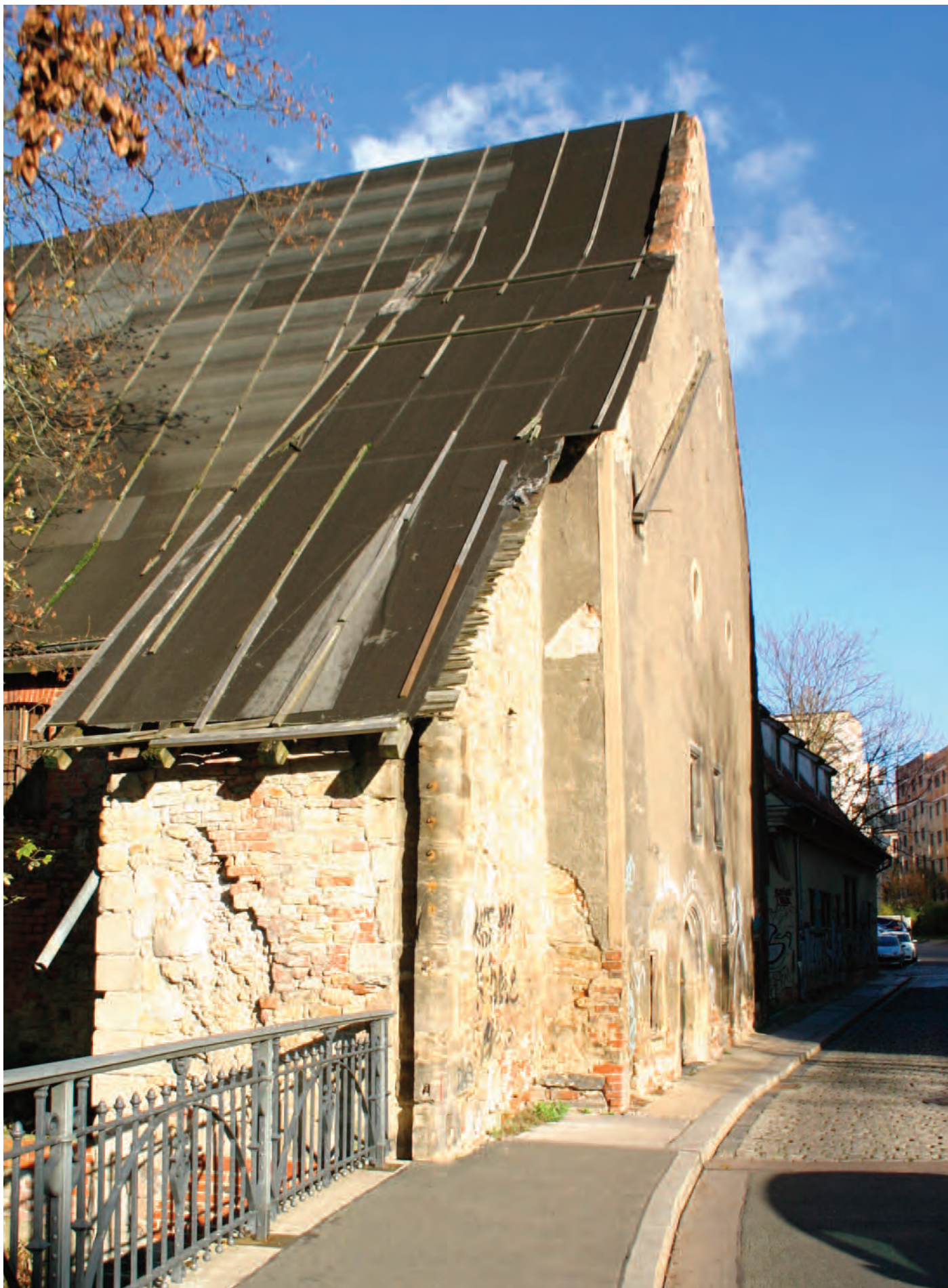
Nr. 11: Neumühle, ehemalige Ratsmühle; Mühlpforte 3–5, o61o8 Halle (Saale), südlicher Giebel von Westen