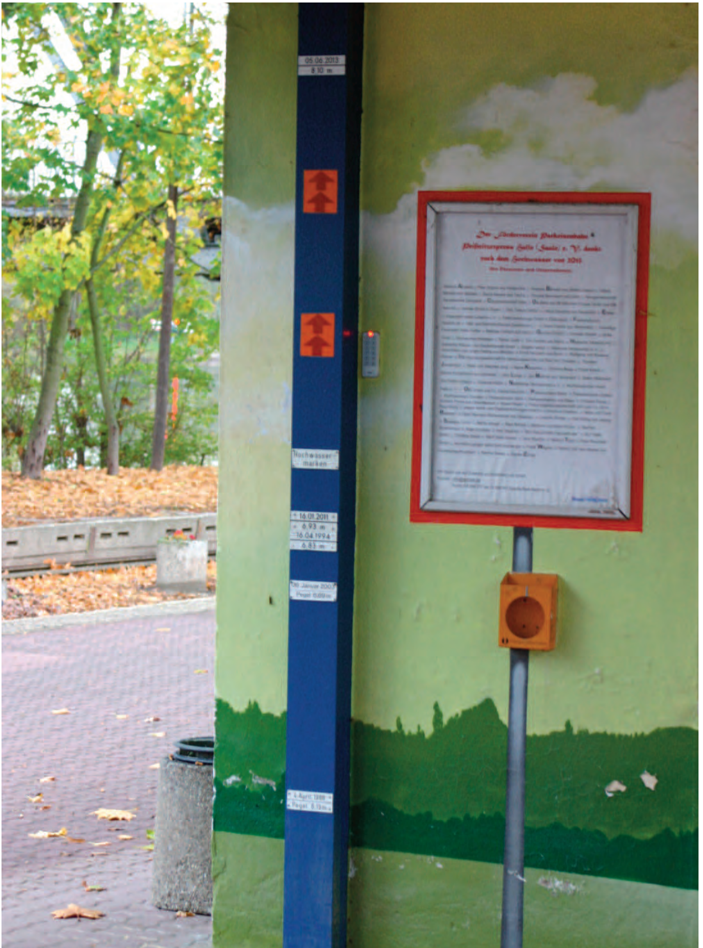
Nr. 10: Parkeisenbahn - Peißnitzexpress, Stahlstütze des Bahnhofdaches mit fünf HWM