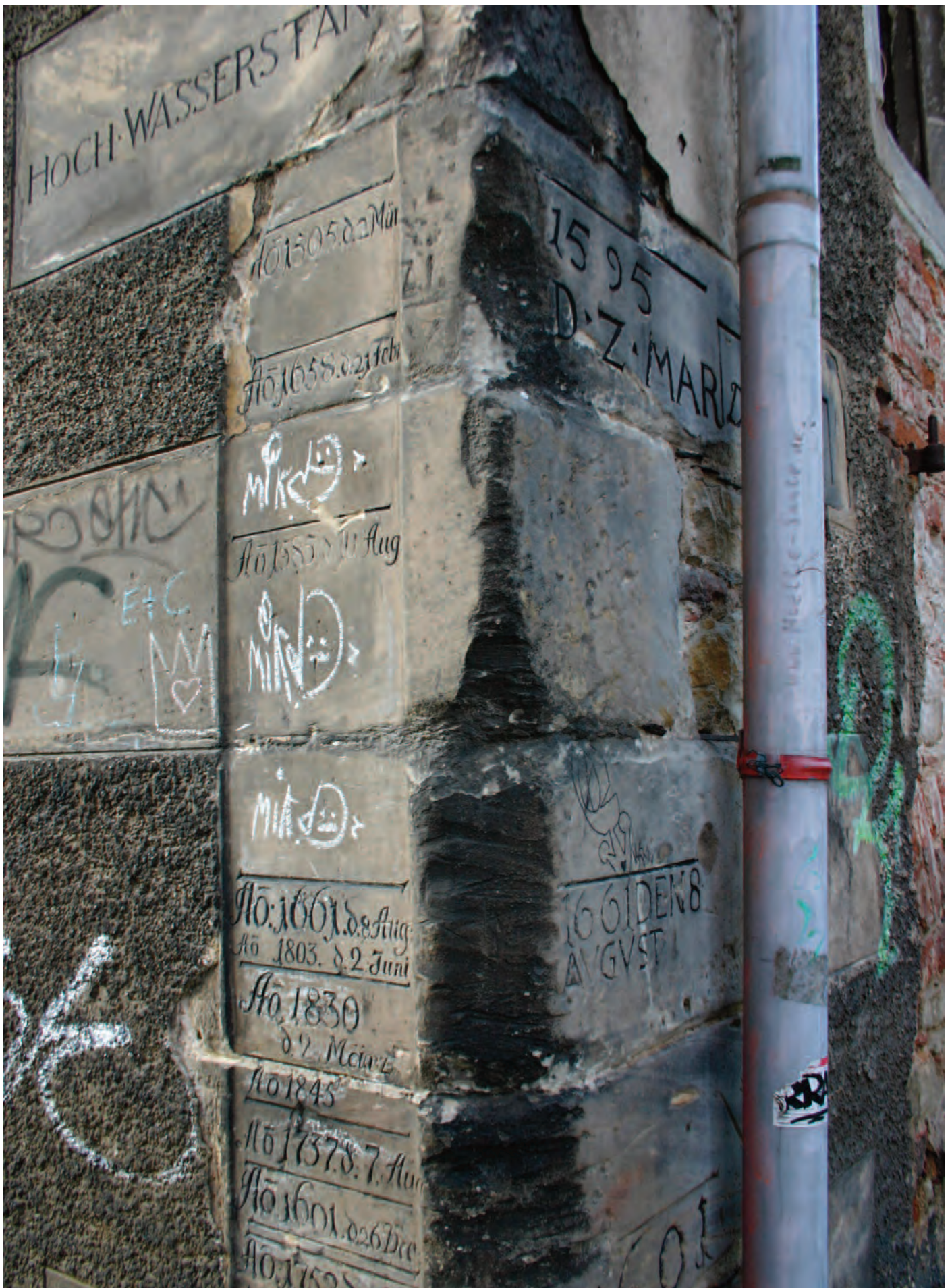
Nr. 11: Neumühle, südöstliche Eckquadrierung, Ost-Westseite mit HWM, Ausschnitt