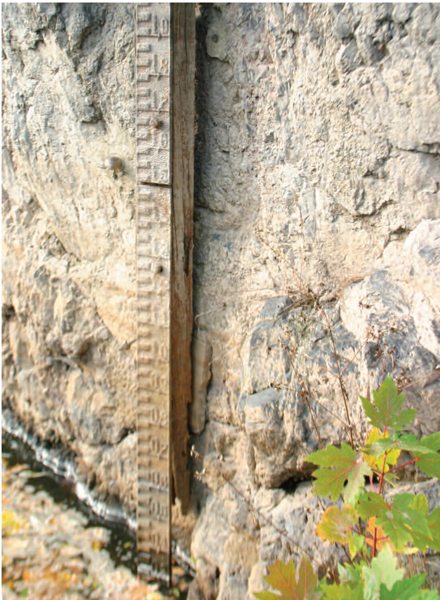
Nr. 4: Pegellatte (Binnenpegel, Gußeisen), talwärts, linksseitiges Ufer (Kröllwitz), unterhalb des Kefersteinschen Felsens, Detailansicht (Ausschnitt)