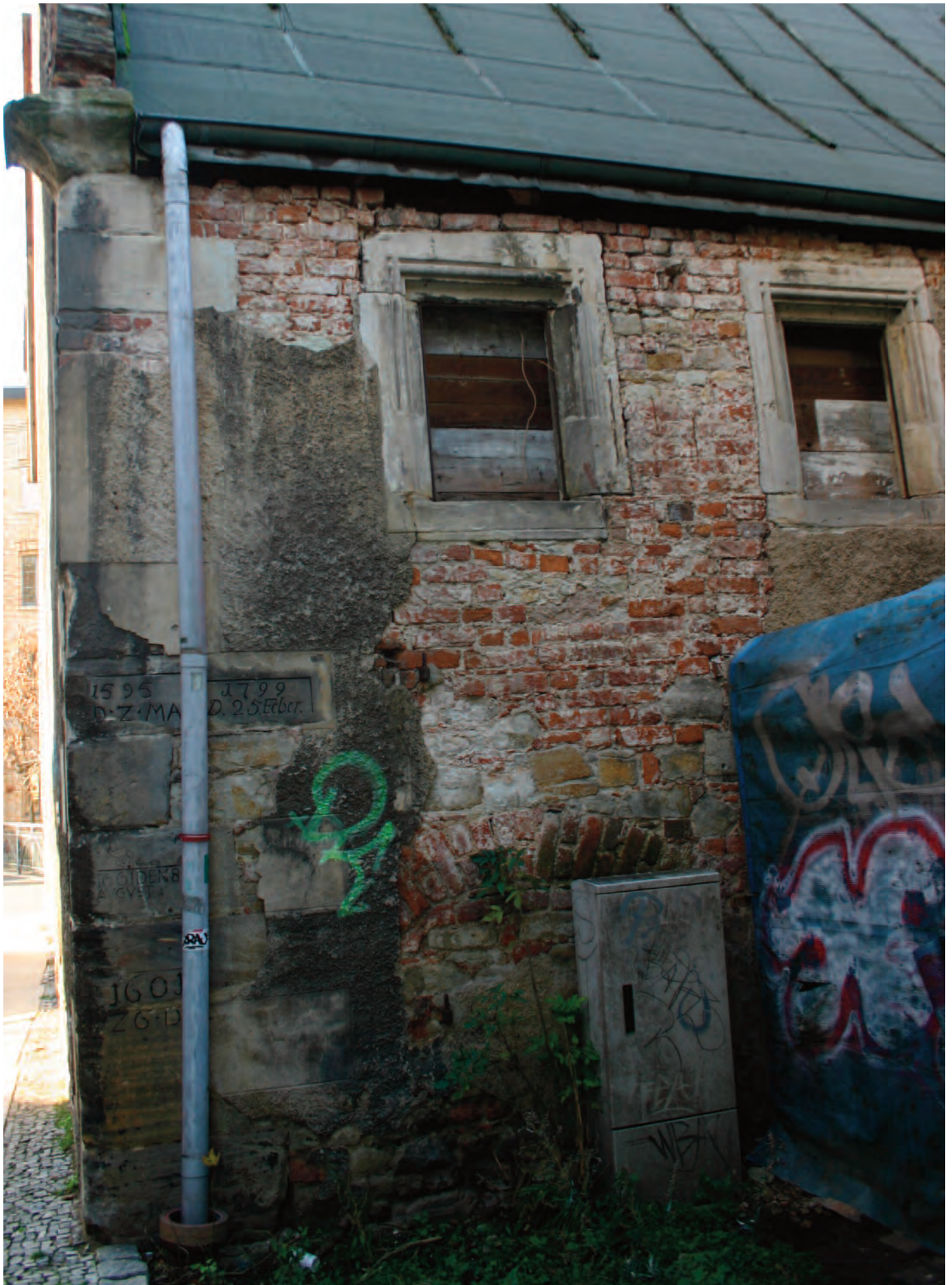
Nr. 11: Neumühle, südöstliche Eckquadrierung, Ostseite mit HWM