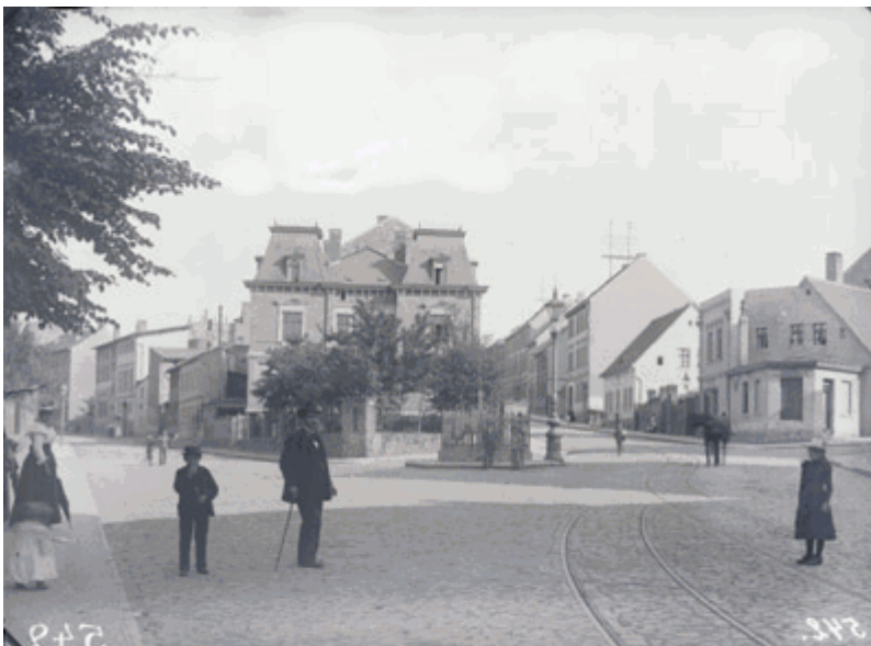
Lutherlinde, Ecke Große Brunnenstraße und Triftstraße, Gottfried Riehm, 1895

Von der Großen Brunnenstraße geht in der rechten Bildhälfte die Triftstraße ab. Erst 1913 wurde die Straßenbahnführung aus der Triftstraße herausgenommen und in die Große Brunnenstraße und Richard-Wagner-Straße verlegt. Die in der Bildmitte zu erkennende Lutherlinde wurde am 10. November 1883 aus Anlass des 400. Geburtstages von Martin Luther gepflanzt.